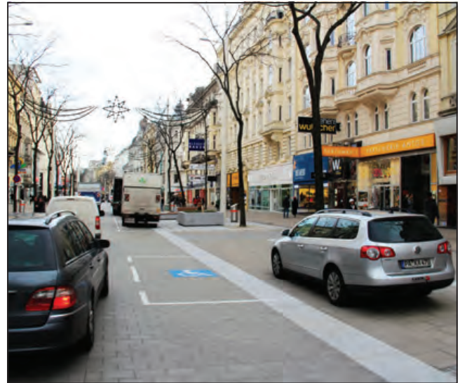
A vegyes forgalmú szakasz kezdete a táblával. Ezen a szakaszon a rakodó- és mozgássérült parkolóhelyeket is pontosan kijelölték

ezer ember keresi fel (gyalogosan, biciklivel, tömegközlekedéssel), és az átépítést támogatók aránya 71 százalékra nőtt.