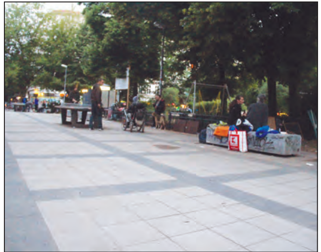
A berlini Helmholtz tér: egy magasszintű játszótér részlete, illetve a tér közepét elfoglaló alkoholisták és lakástalanok

csoportok saját értékeiket tették kizárólagossá, a társadalmi kirekesztés ezzel még erősebbé vált, mint a felújítás előtt volt.