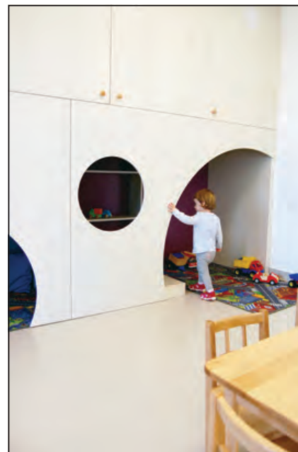
Bejárat, szószoza, mama-baba szoba és kuckó: az Idesüss Óvoda változatos tereket kínál fel a használóknak

napi élet szempontjából fontos: a különböző korú gyerekeket egy helyre hozzák a szülők, mégis az életkornak megfelelő, védett terekben vannak. A foglalkoztató szobák felszerelése, a hatalmas tornaterem és a kültérben kialakított specifikus játékterek (focipálya, közlekedési park, homokozók) a differenciált képzést teszik lehetővé. Legalább ilyen fontos azonban, hogy a közösség egésze számára használható terek is legyenek. Az alapítványvezető a hatalmas közös folyosó kapcsán jelezte, hogy bár elsőre meglepő adottság volt, de mára az intézmény egyik meghatározó fontosságú tere lett. Nagyon sokféleképpen hasznosítható közös aula lett, ahol még futóversenyt is rendeztek a gyerekeknek. Ingergazdag ez a környezet is, ahol a padlóminta és a pe-