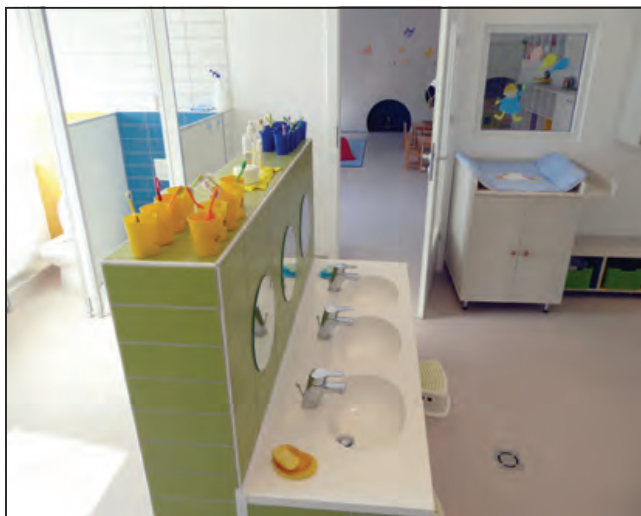
A játékos ötletek, részleteikben kidolgozott megoldások mind a külső, mind a belső tér általános jellemzői

illő, egységes világként jelenik meg. Nem orvosi, gyógyító jellegű ez a hely, hanem egy sarki kuckó az óvodában. A tér is azt üzeni, amit a pedagógiai szemlélet: a gyermekek számára a hideg időszakban történő használat természetes része a napi rutinnak. A sószoba elhelyezése és megjelenése arra kiváló példa, hogy a megértett megbízói szándékot hogyan erősítheti a térképzés.