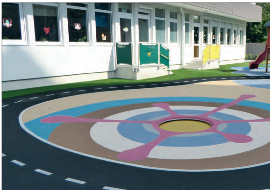
Tematikus játéktér az óvoda előtti udvaron

Az Idesüss óvoda tereit nézve Dániában vagy valamelyik skandináv országban hiheti magát a látogató, pedig Kőbányán, a Sütöde utcában egy önkormányzati tulajdonban lévő, de alapítvány által működtetett intézményben jár. A két bölcsődei és három óvodai csoporttal tavaly megnyitott ovi apró részleteiben is pontosan átgondolt, a nyitott pedagógiai programot támogató, minden elképzelhető igényt felülmúló hely. „Testre szabott” ház.