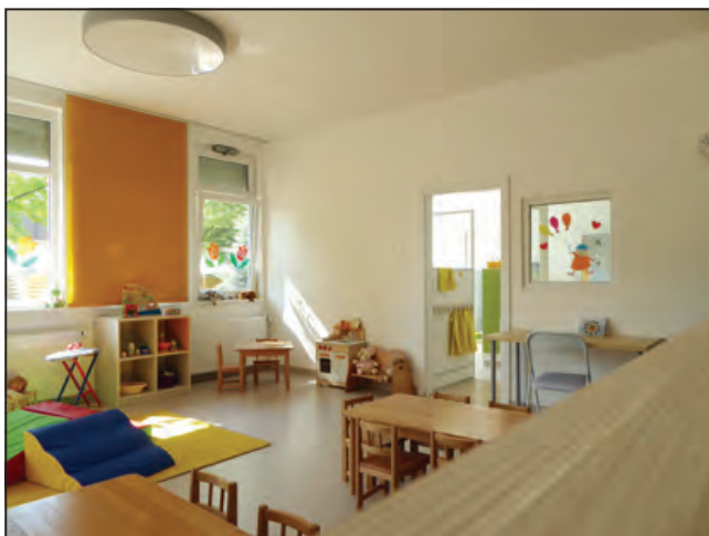
Csoportszoza és kijárat a belső udvarra a széles, multifunkcionális folyosóról. Terv: Borsos Melinda és Dimitrijevic Tijana / MICROArchitects

Két érdekes, fontos helyszínre érdemes odafigyelni az Idesüss oviban, amelyek jól sejtetik az alapítvány szemléletmódját. A bejáratlalt rögtön szemben, a megérkezés közös terében, az említett folyosóhoz üvegfallal határolt szószoza csatlakozik. Látványként is izgalmas, a belső tér a kiszórt sós és a sótéglák ellenére az egészhez jól