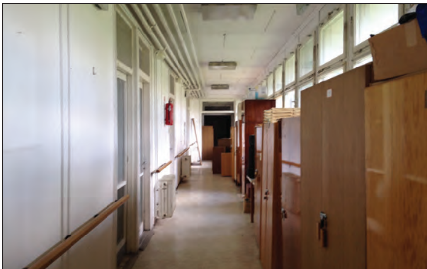
Jellemző folyosó az átalakítás előtti időből