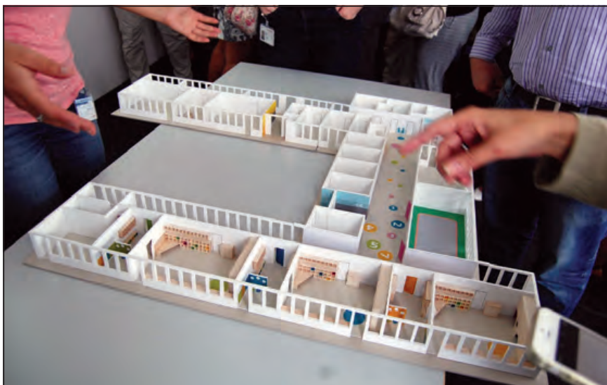
Szülők, óvodapedagógusok és építészek egyeztetése a makett segítségével

pedig nagyon is újszerű és a feldolgozás és a tervezés szempontjából egyáltalán nem könnyű információszerzés a vágygyűjtés. A szemlélet sajátossága éppen a lakótelepek és lakótelepi iskolák, óvodák tervezésével szembeállítva mutatkozik meg. Amíg a 70-es években típustervek alapján dolgoztak – az átalakított épület is ilyen –, s az iskoláról, óvodáról a tervezők számokat és általános elvárásokat kaptak, addig a mai helyzetben a konkrét emberi cselekvés, az épületben folyó élet a kiindulási alap. Ez persze nem jelenti feltétlenül azt, hogy típusterv épület ne működhetne sikeresen, de azt igen, hogy legalább a mikrokörnyezet alakítása során fontos a kommunikáció az épületet működtető és használó közösséggel.