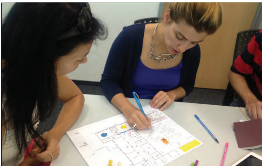
Vágygyűjtés és „tollbarajzolás” kreatív módszerével pontosított program