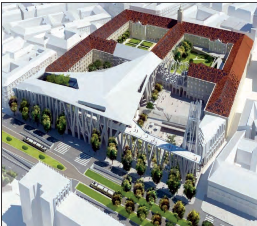
Városháza, Eric van Egeraat terve 2008

az alapozást és a falazást, mert a telekről egyre-másra tűntek el az építőanyagok és a szerszámok, de a homokos pesti talaj nehezítette a munkát.