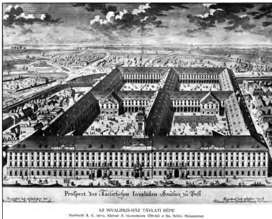
Magyar Művészet, 1930