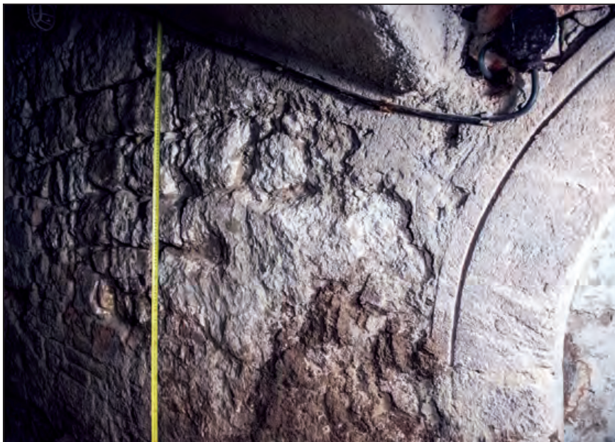
Az első periódusból megőrzött, pinceággá alakított tér déli határoló falánál jól látszik a tiszta kváderfalazás

nált téglák, azok bélyegei. Ilyenek csak a 18. század végétől voltak forgalomban, vagyis ezt a „rendezést” kizárólag Festetics hajthatta végre. (A keleti főfal áttörését később – ezt megint a téglabélyegek árulják el – a rizalit lépcsődobja felőli oldalon, 1848 után, már a fűvészkeri korszakban zárták le.)