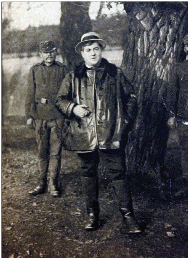
Molnár Ferenc haditudósító a Képes Ujságban

A Doberdó közelében lévő táborban a hadtestparancsnok, József főherceg mindent megtett, hogy katonái feltöltődjenek, és ne unatkozzanak pihenőidőben. 1915 októberétől a helyben talált kőanyagból komplett, lakható, fűthető barakkváros készült. Kuglizót és láncos hintát is felállított vitézei örömére, 1916. március 1-jén