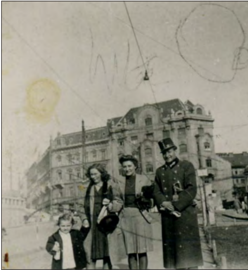
A front szünetében, egyenruhában, háttérben a Boráros téri bérpalota