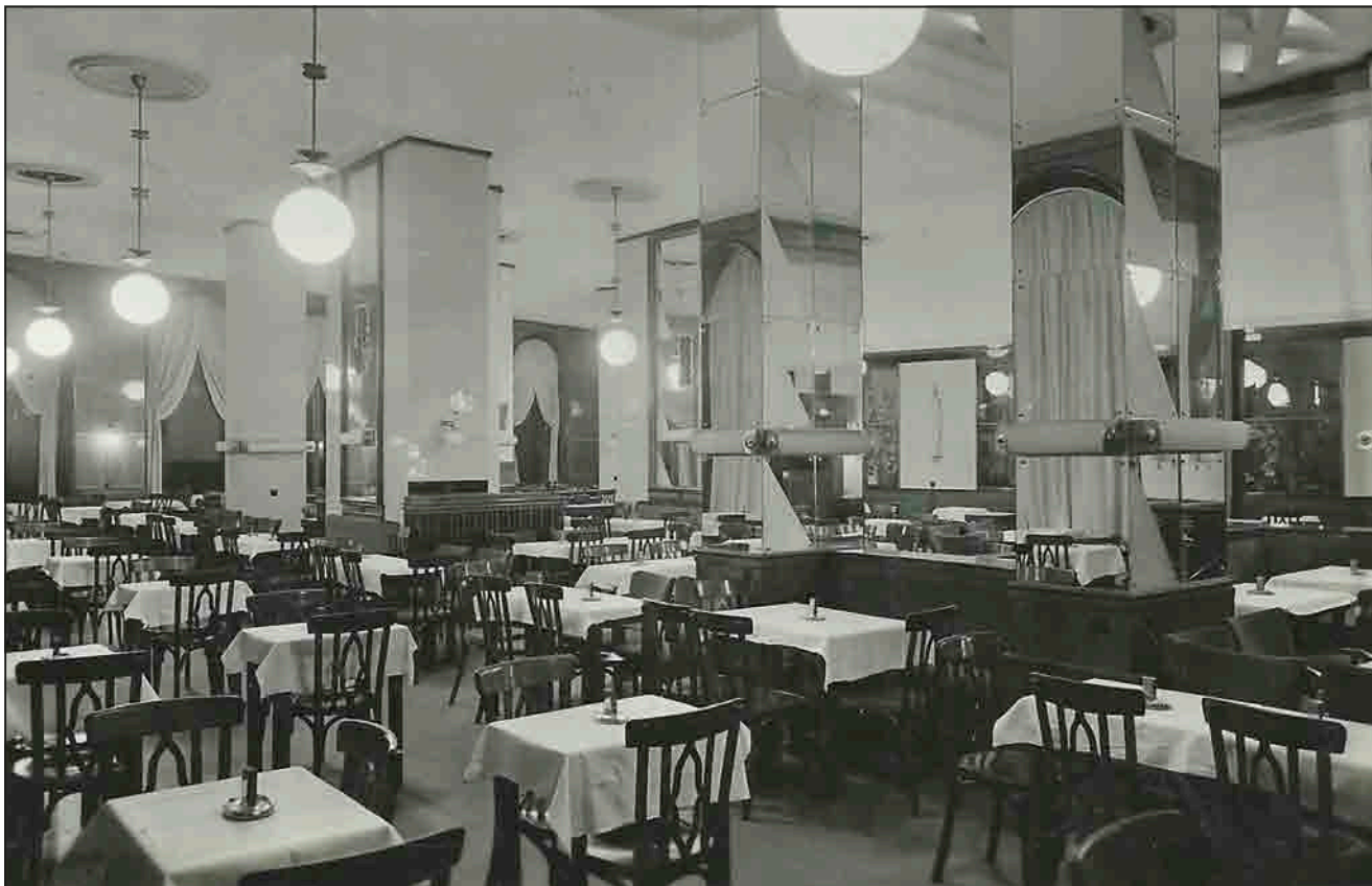
Baross kávéház (képeslap, 1938 körül)