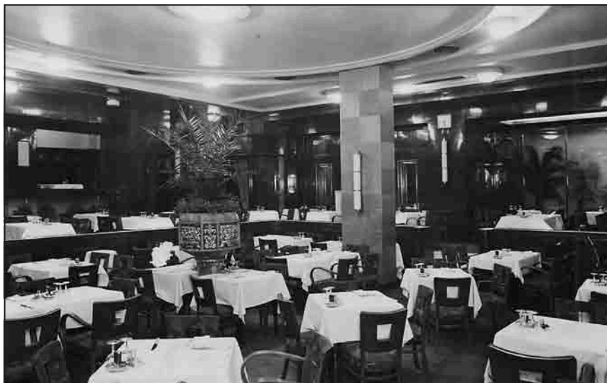
Erdélyi Borozó (képeslap, 1940)

Az eleinte Mikszáth törzshelyeként, majd „a sakkozók Mekkájaként” ismert vendéglátóhely a húszas években kezdett hanyatlani (az irodalmárok és más törzsvendégek soha-