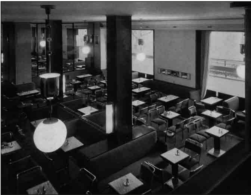
A Savoy kávéház belső tere (fotó a Gastätten c. albumból, Stuttgart 1939)