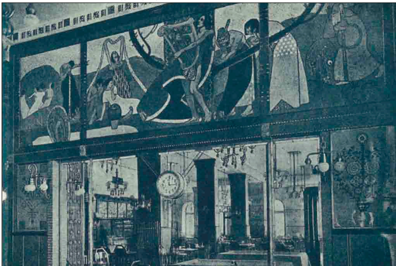
Az Emke kávéház első átalakítása – tükörfal képpel (képeslap, 1912)

A háború miatt lelassult, majd a huszas évektől felélénkült modernizálás mindezekelőtt e szó tartalmát illetően váltott ki érdekes vitákat. A Bauhaus művészeti iskola megjelenésével, illetve az ott dolgozó magyar építészek és iparművészek ismertté válásával egyszerre minden „Bauhaus” lett,