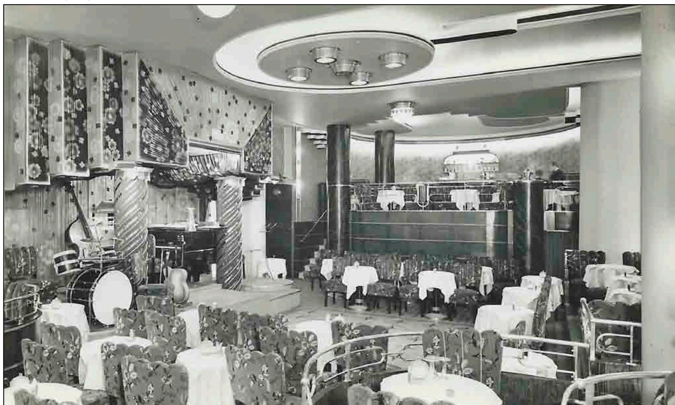
Emke Grill (képeslap, 1937)

A frissítési láz végigvonult a Körúton, és elért a Nyugati téri Vigszínház kávéházig. (Kozma Lajos terve minden részletében modern volt, Bodor Ferenc szerint „a belépőt rögtön mellbe vágta a falakat borító rengineg új anyag, ezek meleg, lüktető színhatása,