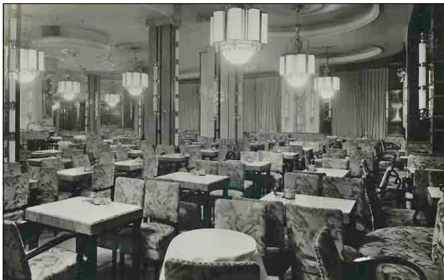
Emke „Dancing-bar” (képeslap, 1937)