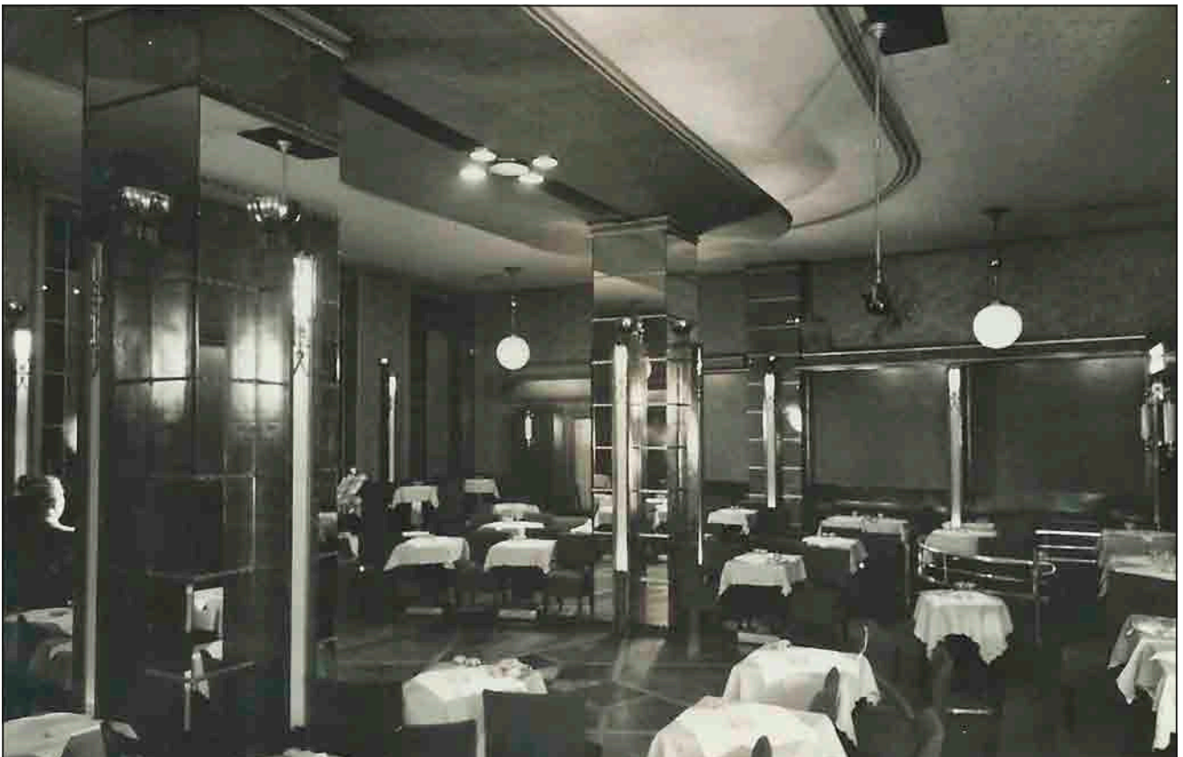
A Spolarich kávéház (képeslap, 1940)

Az új tulajdonosok megtartották a régi nevet, de a helyiséget teljesen átalakították. Ekkor a modern áramlatokkal tartva – és néhány kortárs kávéház sikere és példája alapján – a régi belső teret több részre osztották, kialakítottak egy grill-bárt, meghittebbé tették a hangulatot. Az üzletmenet fellendült, de a „jobbra tolódás” miatt már sohasem érte el újra, amit fénykorában.