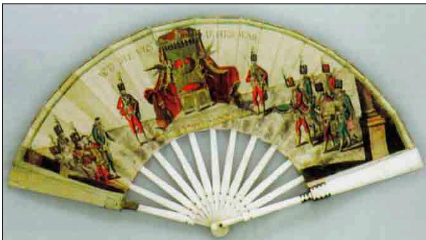
A legyező a korona Budára érkezése alkalmából készült

1790. január 26-án II. József a halálos ágyán írta alá azokat a dokumentumokat, amelyekkel visszaállította monarchiájában a tíz évvel azelőtti állapotokat. A „kalapos király” kudarcának egyik oka abban az érzéketlenségben keresendő, amellyel a jogara alatt élő népek hagyományaival szemben viseltetett. Ennek fel- és beismeréseként értékelhetjük azt a rendelkezését, amellyel Budára küldte a magyar közjogi gondolkodásban különleges szerepet betöltő koronát, sőt a koronázást is kilátásba helyezte.