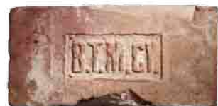
A Budapesti Téglá és Mészégető Gyár (BTMGY) jele