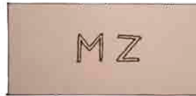
Mathias Zitterbarth téglajele