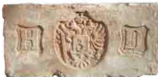
Heinrich Drasche „udvari szállítói” és üzleti téglajelei