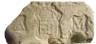
Alois Miesbach pesti téglajelei