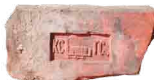
A Kőbányai Gőztéglagyár Társulat Pesten (KGT) téglajele