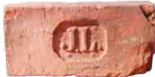
A száz évig működő Lechner téglagyár néhány jele