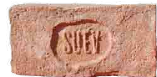
A Sugár Úti Építő Vállalat téglája