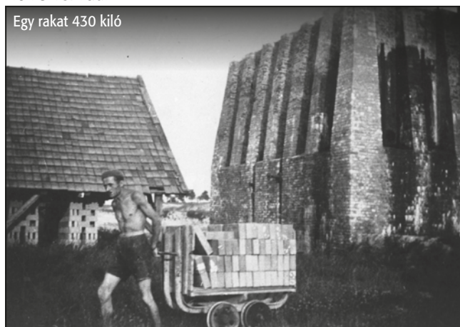
Egy rakat 430 kiló