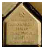
Kisméretű, járdaburkoló keramit téglák