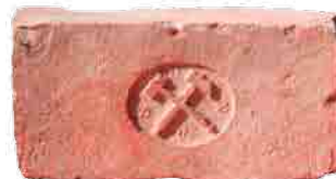
A Kőszénbánya 's Téglagyár Társulat Pesten téglajelei