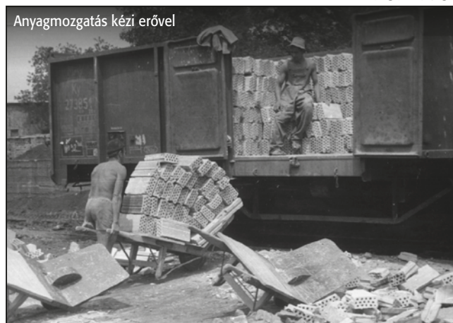
Anyagmozgatás kézi erővel

viszont csak annyit változott, hogy a H D, máskor (magyarul) a D H betűrendet használták. 1864-ben megszerezték a Duna mellett fekvő Gubacsi téglagyárat is. A pesti vállalat tovább fejlődött, és 1867-ben már évi 30 millió téglát, dísztéglát értek.