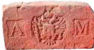
Alois Miesbach bécsi téglajele