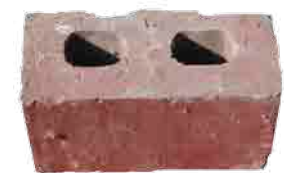
Samott, klinker és traverz téglák