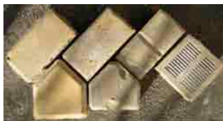
Útburkoló keramit téglák és keramit burkolólapok