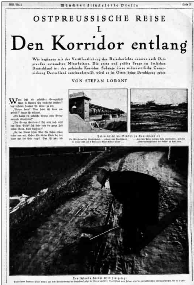
Lóránt István képriportja, Münchner Illustrierte Presse, 1932