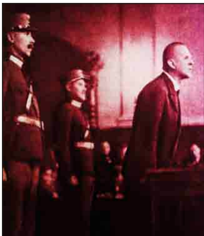
Matuska a bíróságon

A Hajnal műteremtől a Klauzál utca által elválasztott 48. számú másik sarokházban 1926–1928 között kapott helyet az EMKE Fotószalon, majd ezt követően itt dolgozott Eiser M. fényképész, akitől a legutóbbi időben is gyakran bukkannak fel különböző árveréseken politikusokat s a társasági élet szereplőit a harmincas évekből megidéző fotográfiák.