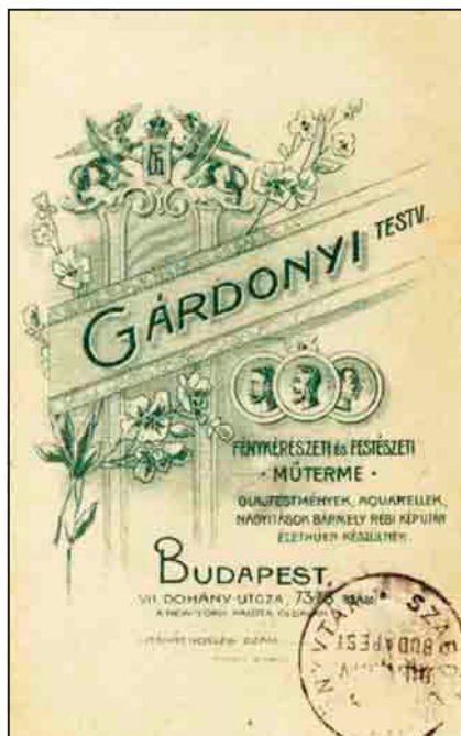
Gárdonyiék képeinek hátoldala

A Hajnal műteremtől a Klauzál utca által elválasztott 48. számú másik sarokházban 1926–1928 között kapott helyet az EMKE Fotószalon, majd ezt követően itt dolgozott Eiser M. fényképész, akitől a legutóbbi időben is gyakran bukkannak fel különböző árveréseken politikusokat s a társasági élet szereplőit a harmincas évekből megidéző fotográfiák.