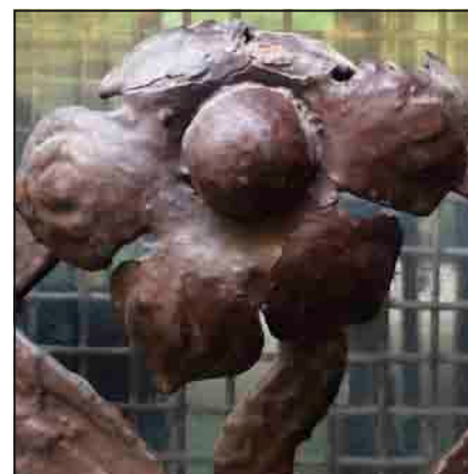
A Dohány utca 73-75 kapujának részlete

A két világháború közötti korszakban a fotókultúra Dohány utcai képviselőinek múltját, pályafutását szemlélve két jellegzetes tendencia érvényesülése látható. Az egyik: a város valamely távolabbi pontjáról ide kerülni – esetenként innen még központibb helyszínekre, alkalmasint túlünk nyugatra eső külföldre eljutni – a szakmai/anyagi siker megtestesülését