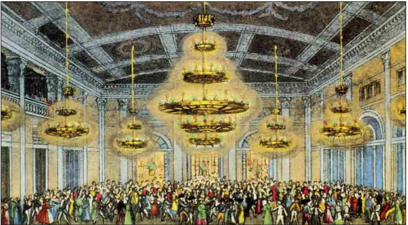
Schwindt Károly 12 hónap Pesten című képes kalendáriumában a Redoute bálterme díszítette a februári lapot

Egyszer volt, hol nem volt a pesti Duna-parton egy csodaszép városi táncterem, amelyet a köznyelv csak úgy emlegetett: a Tündérpalota. Hivatalos nevén ez volt a Redoute. Pollack Mihály tervei alapján épült, 1833-ban adták át a nagyközönségnek. Tizenhat év múlva, a szabadságharc alatt a budai Várat védő osztrákok ágyútüzében homlokzata beomlott. A pestiek mentették, ami menthető, a díszterem egyik csillárja ekkor