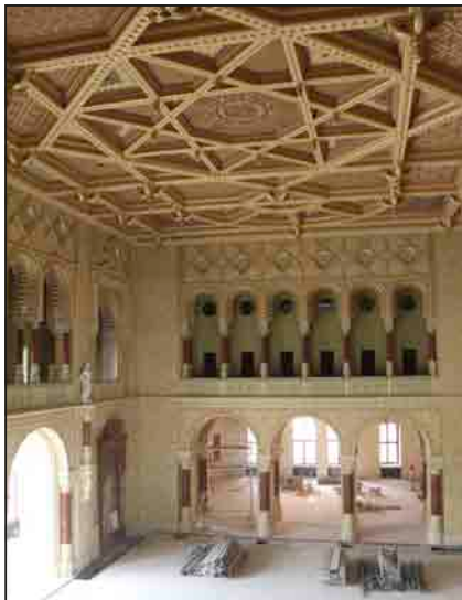
A díszterem a felújítás végéhez közeledve

Than Mór és Lotz Károly falképei az idén átadott felújított palotában olyannyira élette-