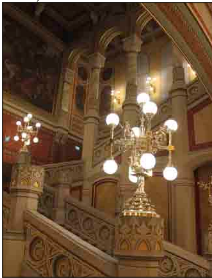
A díszlépcsőház a mives kandelábrekkel

Nézzük végig a házat. Időutazásra invitálom az olvasót. A földszint a vendéglátás színtere volt másfél százada s aztán sok-sok évtizeden át. Északon étteremmel, délen (a mai galéria helyén) kávéházzal. A Vigadó restaurant eredeti öntöttvas oszlopai közül néhány a legutóbbi felújítás került elő. E váratlan lelet szolgált mintául az újonnan kialakított szintek és az új hátsó lépcsőházak oszlopaihoz.