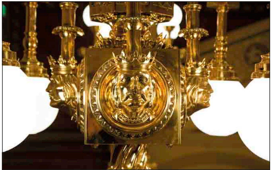
„Feszli Frigyes eredeti terve alapján”