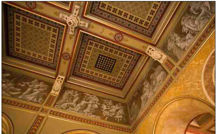
A díszlépcsőház frízében Tündér Ilona és Árgyelus királyfi története kelt életre

A függőlegesen mozgatható csillárok rekonstrukciója szépen sikerült, és a mennyezet kifestése is a múltat idézi. A címereket könnyen pótolhatták (középen Magyarország, a négy sarokban Erdély, Horvátország, Szlavónia, Dalmácia), de a Than Mór által megfestett négy folyóallegória (Duna, Tisza, Dráva, Száva) helyét, megfelelő források hiányában, geometrikus mintával töltötték ki. Az 1885 után felhelyezett szobrok másolatai sem kerülhettek vissza a talapzatokra. A főváros képzőművészeti bizottsága négy táncoló nőalak megmintázására kérte fel a művészeket ( Stróbl Alajos, Bezerédi Gyula, Füredi Richárd ). A gipszből készült, közel kétféle méteres alkotások (Csárdás, Menüett, Fandangó, Polonéz) azonban a háborúban megsemmisültek, s mivel nem volt mindről fénykép vagy leírás, négy honfoglaló vezér vette át a hölgyek helyét. Ezek is másolatok,