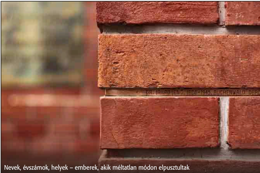
Nevek, évszámok, helyek – emberek, akik méltatlan módon elpusztultak