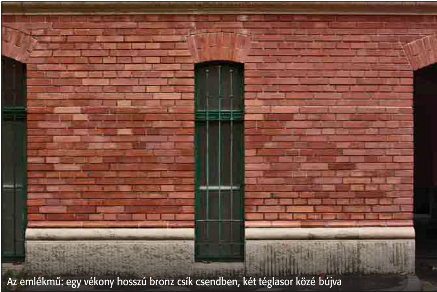
Az emlékmű: egy vékony hosszú bronz csík csendben, két téglasor közé bújva