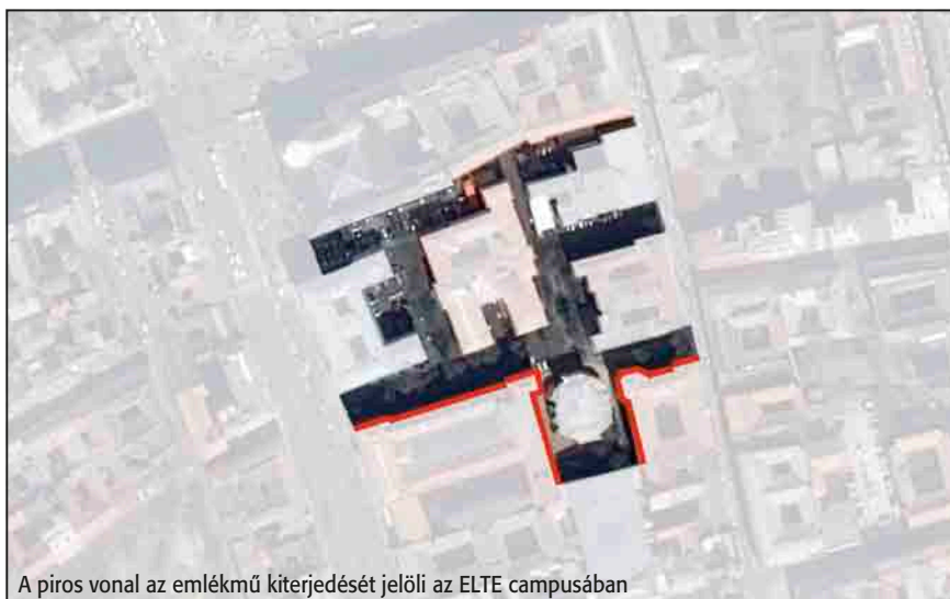
A piros vonal az emlékmű kiterjedését jelöli az ELTE campusában

A Trefort-kerti emlékművet a személyes élmény felől a legkönnyebb megfogalmazni. A kialakított helyzetnek ez a közvetlen értelmezhetősége egészen különleges sajátosság. Merthogy a nemzeti traumákat ábrázoló szimbolikus, heroikus avagy absztrakt emlékművek láttán gyakran éppen hogy zavarba jön az ember: keresgéli magában az értelmezési lehetőségeket, ingadozik a szimbolikus kép és az ábrázolt figura között, jelentés-zavartan álldogál, gondolkodik, értékel. De távol marad. György Péter esztéta, médiakutató, egyetemi tanár, az emlékhely létrehozásának egyik kezdeményezője így fogalmazta meg szándékukat: „Az a benyomásom, hogy az elmúlt évtizedekben a 19. századi emlékmű-szobrászat