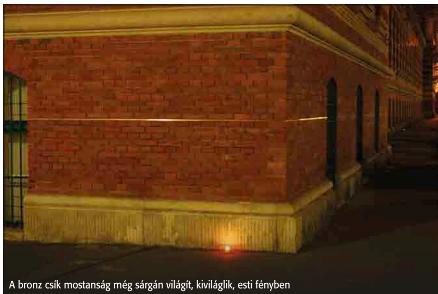
A bronz csík mostanság még sárgán világít, kiviláglik, esti fényben

Rövid, tényszerű állítás. Az emlékművet létrehozók szerint nem volt könnyű megfogalmazni. Értelmezhetjük ezt tágabban is: hetven év kellett hozzá. ●