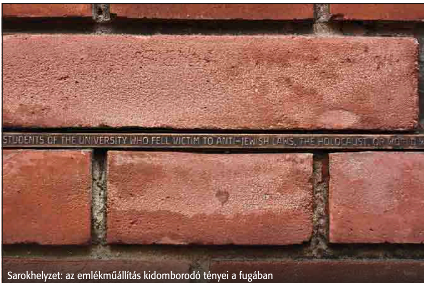
Sarokhelyzet: az emlékműállítás kidomborodó tényei a fugában