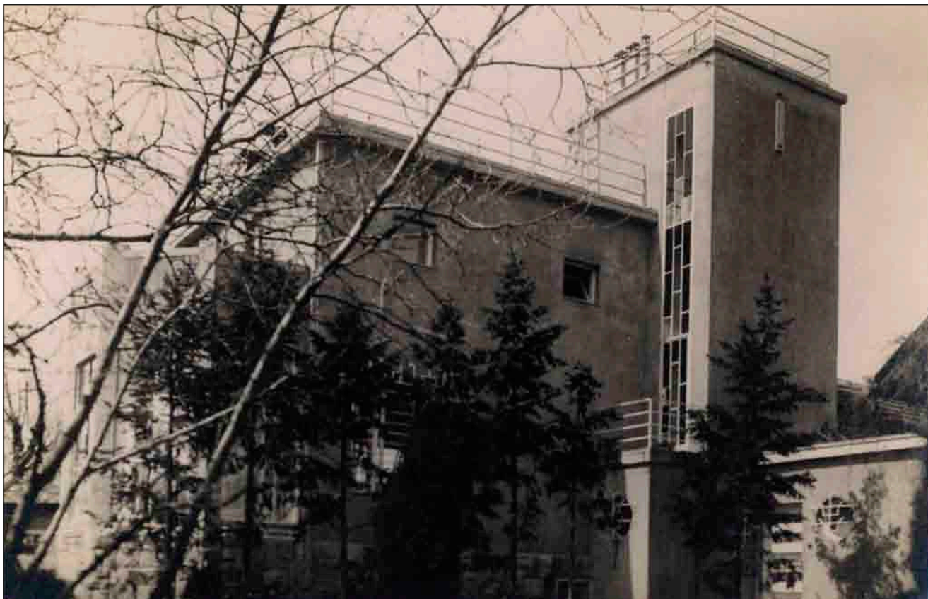
A villa vadonatúj korában