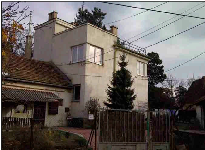
A „végállapot” az utca felől