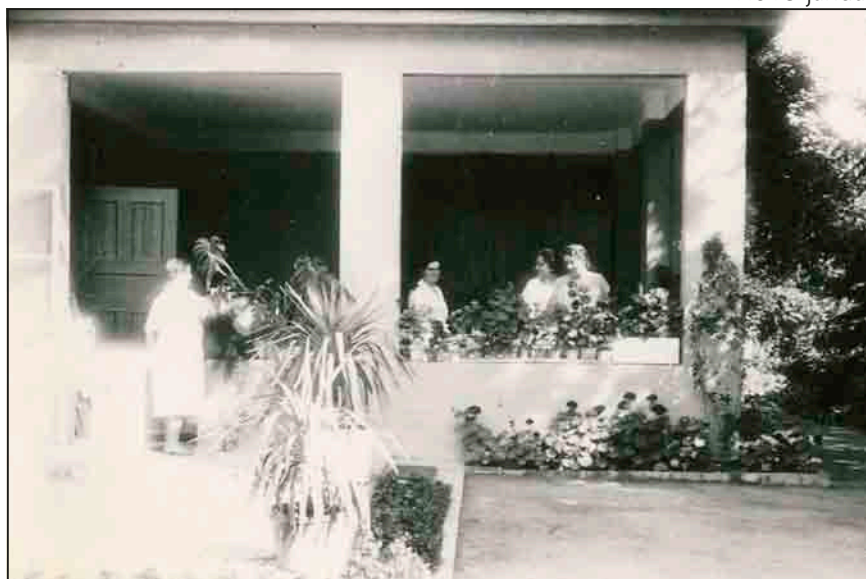
A lapostetős veranda, amikor még a család használta

Néhány műszaki érdekességre is felhívom Tisztelt Olvasóim figyelmét. A lépcsőház-ként funkcionáló torony egyben a víztorony