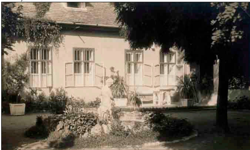
Az öreg ház képe 1907-ben és a műkö-beton kertdíszek

is volt, aláírása nélkül az építőmester sem kaphatta meg járandóságát. Az elszámolás szerint egyébként ez az épület 36 ezer 563 pengő és 50 fillérből épült fel.