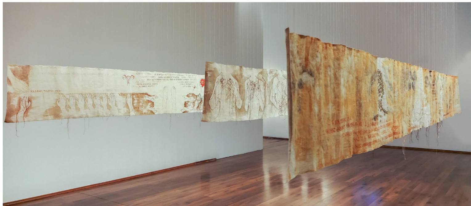
RICHTER SÁRA Gyógyítások 1-3, 2020, textilinstalláció, 3 db festett lenvászon, vegyes technika, egyenként 50 x 500 cm

közeledő haláláról adott hírt, A fűgefa elszáradása (2020) pedig azt az esetet alludálja, amellyel a hit teremtő erejét világította meg a tanítványok előtt, de a kép a fa kiszáradása helyett más csodás eseményeket láttat.