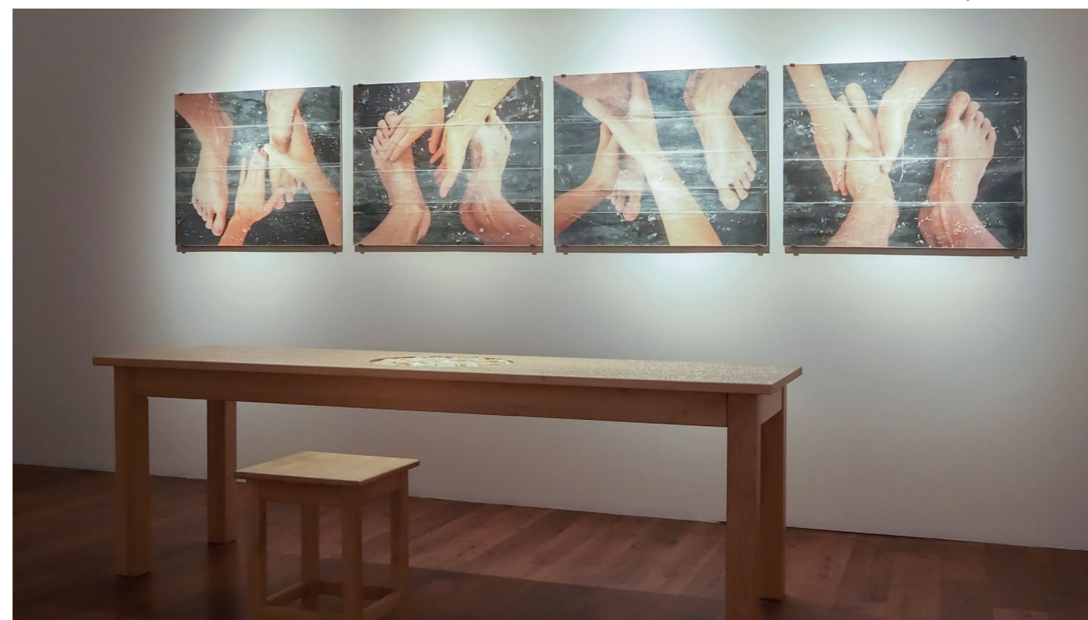
Kiállítási enteriőr LOVAS ILONA munkáival, Evangélium 21 , MODEM, 2021

SZELLEI LELLÉ huszonöt darabból álló Ikonosztázát (2020) az az összefüggés teszi érdekes kísérletté, hogy az ortodox és görögkatolikus egyházak templomszentélyét a templomhajótól elválasztó képes fal, amely rendszerint a nemes anyaghasználattal is az ábrázolt történetek és szimbólumok örökérvényűségét hangsúlyozza, itt egy meglehetősen mulandó eszköz, a papírkollázs alkalmazásával készült el, jórészt újrahasznosított csomagolóanyagok felhasználásával. A félabsztrakt képek a keresztre feszítéstől a feltámadásig terjedő időszakot idézik elénk szimbólumok és az evangéliumból vett szövegrészek, Biblia-kivágatok kollázsalkalmazásával. A körbejárható kiállítás végén pedig, mintegy a kiállítást keretezve, újabb művet láthatunk a fény kifejezőerejével és a keresztény szimbolikával is gyakorta kísérletező Mátrai Eriktől. A Monstrancia (2020), amely a római katolikus liturgiában a szentostya ünnepélyes megmutatását szolgáló edény felnagyított mását állítja elénk, az átváltozás eseményére utaló ostya hiányában jelenik meg. A négy színű fényvel megvilágított, körbejárható szentségtartó másolat e hiány központba állításával visszautal a műnek teret adó közegre, a kiállítóterre, amely lehetőséget adott a dogmatikával összefüggő, ám azzal sokszor nehezen összeegyeztethető állítások, alternatív írásértelmezések megfogalmazására, sőt, a szöveghelyek szentségéről megfélekedezni kész adaptációk készítésére is.