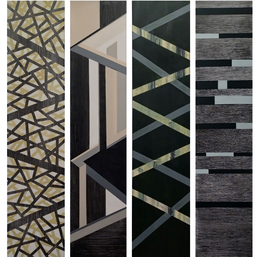
KOSCSÓ LÁSZLÓ Neutráliák , 4 mű, 2021, akril, vászon, 180 x 40 cm egyenként

pontos, összefüggő alakzatok konstruktivista rendszere. Nincs ábrázolás (Laukónál sem), hanem struktúrák vannak, összefüggő vagy egymásnak ellentmondó alakzatok, pontosan kiszámított egyensúly és vonalhálózat-rendszer. Finoman szétszálazódó erővonalak laza hűrokként futnak egyik irányból a másikba, fizikai és szellemi energiák hordozóiként, sohasem metszve egymást. Hogy a végtelenben találkoznak-e (à la Einstein), azt nem tudhatjuk, mert addig sem a vonalak, sem a kép, sem a nézők nem igyekeznek elérni. A művész talán azt közli, hogy van, létezik, kapcsolatban áll a feszültséggel teli társadalmi-természeti környezettel. Művei belső világának leképezése, s talán mindannyiunk belső világáé is. Koscsó talán éppen e feszültségek megoldásán dolgozik. Neutráliái a képi energiáknak és egyúttal saját energiáinak vizualizálása. Lágy, visszafogott, érzékenyen színezett szürkéket használ, a festék rétegekben kerül a képfelületre, ezek átsejlenek egymáson, ki-kivillan egy-egy leheletnyi szín a rétegekből vagy a finom vonalhálók közül. Olyan alkotások ezek, amelyekbe mélyen bele tudunk merülni.