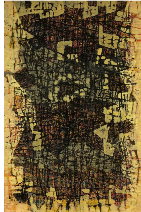
LAUKÓ PÁL A fa tetején , 2021, akril, papír, 130 x 80 cm

nagyon különbözően jelenik meg munkásságukban.