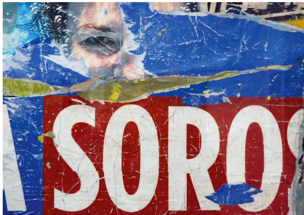
GÉCZI JÁNOS dekolázs 1,70 × 100 cm, 2021

és okkerral (pl. az Enigmatikus tájak sorozat). Seholy egy vidám, az életet, a tápláló és enyhét adó növényzetet idéző, üde kék vagy zöld. Miközben az alkotó talán saját szorongásait festi ki magából, ezeknek a műveknek mély és nagyon is aktuális társadalmi, a világ egészére vonatkozó mondanivalójuk van.