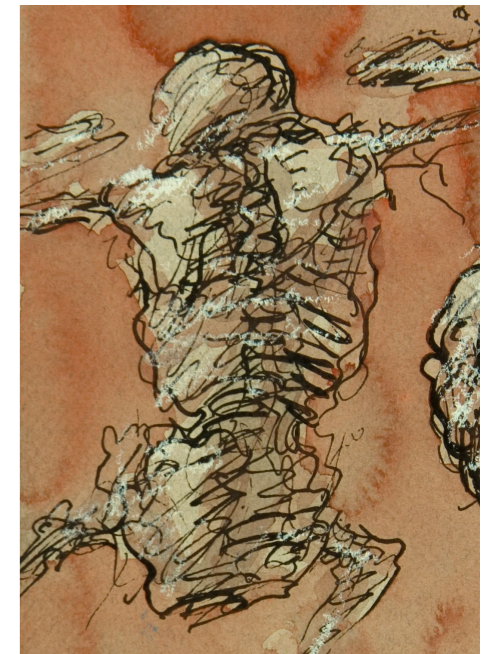
FARAGÓ BÉLA Totentanz