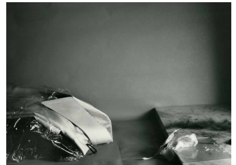
Kerekes Gábor Folyamat 2 , 1987, vintage zselatinos ezüst, 16,5x23,5 cm,