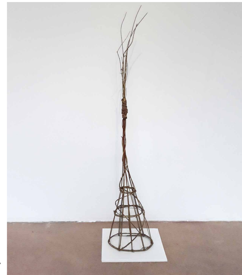
Orosz Péter Tatlinnak, 1998, vas, eperfavessző, festett, 200 x 40 x 22 cm

rejtőzködő alakzatok inspirálták: nem utánozta, hanem kiragadta a természetből az alkotásaiba építhető formát. Először kigondolta a témát, annak tárgyát és alanyát, majd ennek a csakis rá jellemző megvalósításához kereste meg a fát, dolgozta ki annak alakzatát. (Volt, hogy már az erdőben visszametszette a fák ágait, növekedésüknek irányát pedig kötözéssel szabályozta.) Morfológiájában a szerves formák mellett megjelentek a már korábban említett geometrikus alakzatok (kör, gömb, kocka, henger, kúp stb.), ám felvonultatott konkrét tárgyakat (például csúzli, kitüntetés, kerék) és az emberi jelenlétre utaló jegyeket is (lábfej vagy corpus). A hazai kortárs szobrászati nyelv egyik megújítójának munkái stilárisan eltérnek a hagyományos plasztika nyelvezetétől, de a modern szobrászatétól is. Művészetében egyszerre van jelen a tragikum és a humor, a groteszk és a szellemes rafinéria, a szakrális tematika és a profán fogalmazásmód. Egy mélyből áradó szeretetteljes vágy a túlélésre és mások túl-éltetésére. Ezért lehetséges az, hogy Orosz Péter tövissei nem sebeznek, hanem gyógyítanak.