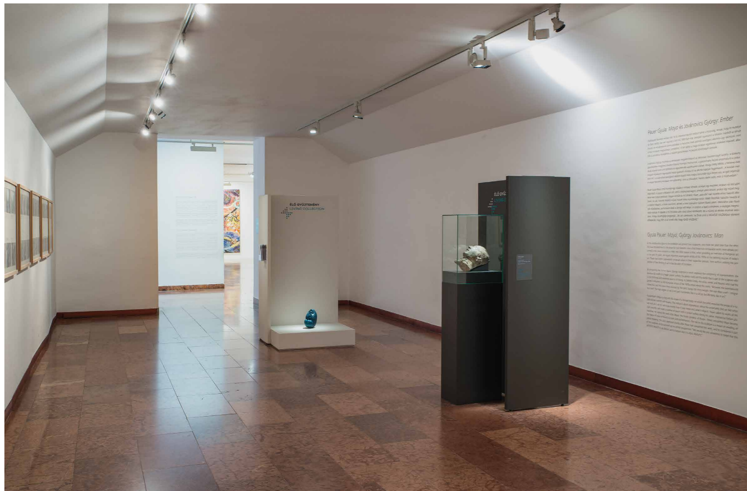
Élő gyűjtemény, Magyar Nemzeti Galéria B, C, D épület, 2019. október 17 – 2020. január 26. (részletek a kiállításból)