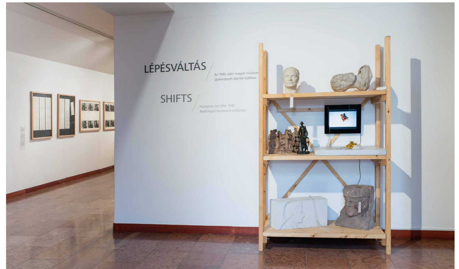
Élő gyűjtemény , Magyar Nemzeti Galéria B, C, D épület, 2019. október 17 – 2020. január 26. (részlet a kiállításból)

tapasztalatainak előhívásával és a reprezentáció folyamatos megkérdőjelezésével, mára a kortárs látogatóra és annak bevonására vetüljön a figyelem fénycsóvjára. A kérdésnek tehát, hogy milyen megoldások alkalmazásával lehet élő, élőbb egy múzeum, a nemzetközi kortárs muzeológiában is konjunktúrája van. Ennek egyik igen fontos lehetősége a gyűjtemények 90%-át szó szerint elrejtő múzeumi raktárak áttetszővé tétele, megnyitása, falainak lebontása, az úgynevezett köztes terek létrehozása. Mindez annak ellenére, sőt annál inkább, minél jobban elérte a múzeumokat is az ökonómia nyomása, a számok csalóka bővölete, ami egyesek szerint „a minőség és éppen e köztes terek 8 rovására kényszeríti a múzeumokat fulladásos halálra” 9 vagy agonizálásra. „Ezek a köztes terek biztosítanak terepet az egyéniség stratégiáinak kidolgozására – egyénit vagy közösségit –, amelyek létrehozzák az identitás új jeleit, az együttműködés innovatív tereit és érvet a társadalom eszméjének meghatározására”