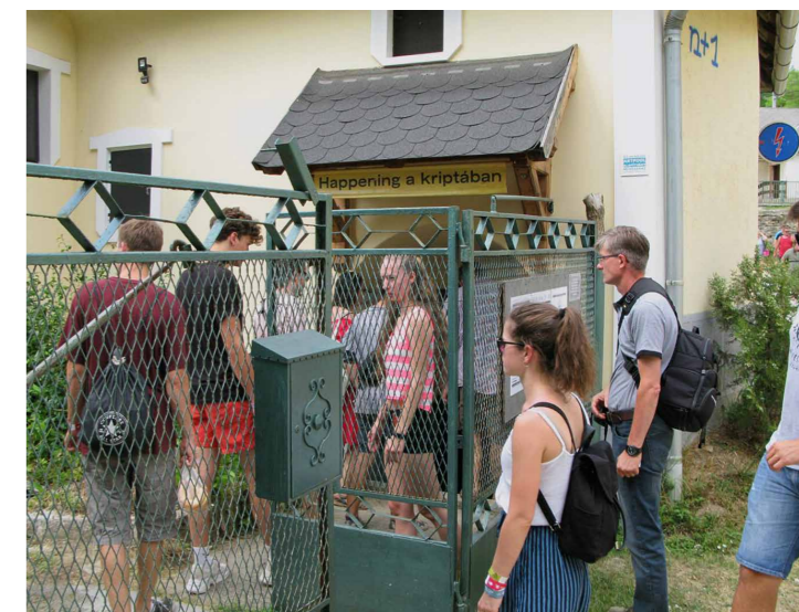
Látogatók az 51-es körzet első pincéjénél.