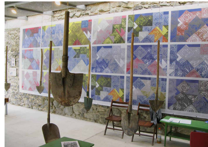
A fedett udvarban Nagy Karcsi kultikus munkaeszközeinek Galántai György Minden nap szép nap című nagyméretű molinóképe ad kontextuális hátteret.

mindenfajta problémára érzékenyek. És nem tudnak megszűnni, illete ha ez megtörténik, akkor egy magasabb szintre emelkednek: egy másik céget csinálnak, egy jobbat. Ez már létezik, zajlik: a japánok kezdték el a holonikus gyártástechnológiát alkalmazni. Intelligens gyártásnak hívják, tulajdonképpen az intelligenciáról szól, arról van szó, hogy a világ intelligensebb lesz.