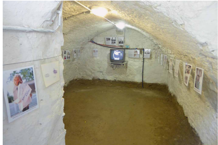
Kiállítási interiőr az 51-es körzet első pincéjében.

nálunk a templomok el vannak hanyagolva, mivel itt szocializmus van, ami egyházzellenes rendszer. Ez volt a témájuk. Én a kápolnát szakrális térnek tekintettem, aminek persze láttam a különbözőségét más épületektől. Eredetileg egy malmot szerettem volna, de malom helyett kápolnát találtam. Egy elhagyott templom, ami deszakralizált, akár malom is lehetne. Gyakorlatilag minden közösségi hely, ahol sok ember dolgozik, az nem magán, hanem közösségi szféra, és szakrális hely – én akkor ezt így fogtam fel, de így gondolom mai is: az 51-es körzet is egy szakrális hely.