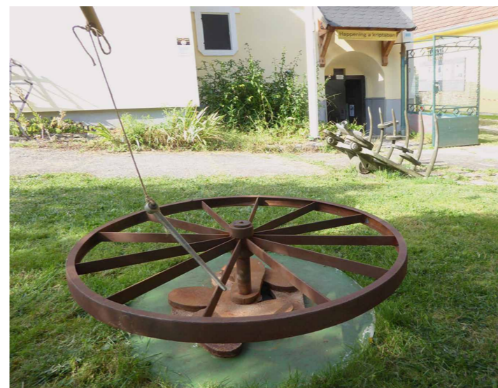
Az első kertben Galántai György: Helybenjáró (1979), a háttérben Galántai György: Szembenállás (1979) című vasszobra.

értelmiség jövőképét megjelenítő TEDx interjúkban hangzóság és gondolatiság (szellem és anyag) keresztezte egymást.