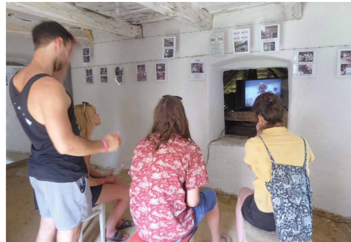
Látogatók a Borostyán ház szobájában, a Ben tér (1993) projektet bemutató kiállításon.

SchG: És a Liszt Ferenc tér is, nem? Azért akarlak erről kérdezni, mert itt a kiállításon, a Borostyán házban, három olyan projekt 9 jelenik meg, amely a Liszt Ferenc teret használta Budapesten a kilencvenes évek elején. Ahogy tegnap mondtad, van egy időtengely Popper Péter 10 és a TEDx között, és mintha itt lenne egy másik időtengely, a kápolnaműterem és a Liszt Ferenc tér között. Az azonos színhelyen túl hogyan viszonyulnak ezek a projektek egymáshoz és az Artpool történetéhez?