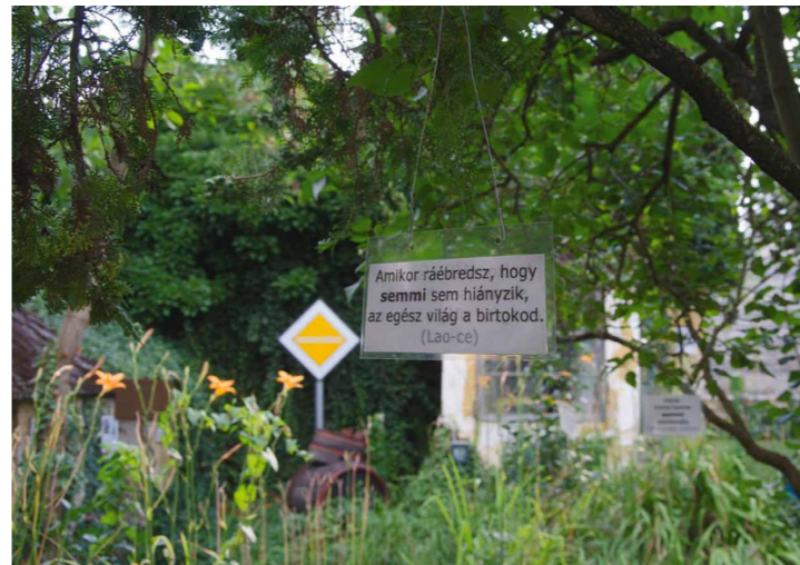
Az első kertben a fákról a semmiről szóló idézetek lógnak.

Kapocson. A nullával akkor foglalkoztunk, amikor átléptünk a 21. századba, tehát ez tulajdonképpen a 21. század dokumentuma, és a költői szövegről van benne szó, Flusser idézem, az írás megváltozásáról szóló gondolatait. Ez komplex dolog: nem csak a művészetéről szól, sőt legkevésbé arról, csak használja mint eszközt, mint ahogy bármi mást is.