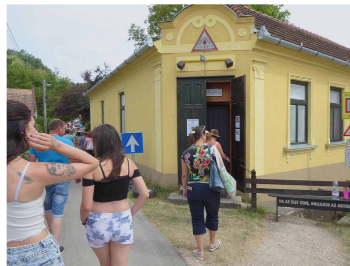
A Galántai-ház (K55) kiállítóter bejárata.