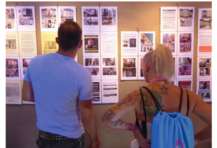
Részlet a K55 Amit nevének neveznek, az van. című összefoglaló, történeti kiállításból.

SchG: Ennek a tíz évnek valamint az előzményeknek dokumentumai vannak kiállítva a K55-ben. Összefoglalnád ennek a történetét?