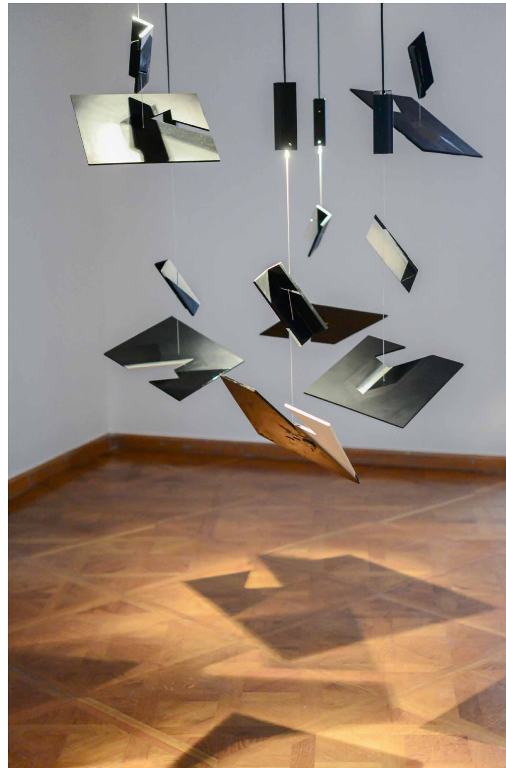
Schmal Károly Lebegő testek, 2002, fa, akril, spárga, fényforrások, változó méret

objektív, tér-leíró lenne, sokkal inkább tereinek spiritualitása jelenti súlypontjukat, miként Bachelard is logikus párhuzamot von lelkünk tere és a ház között: „e helyekre emlékezve tanuljuk meg, miként lakozhatunk önmagunkban”. 1