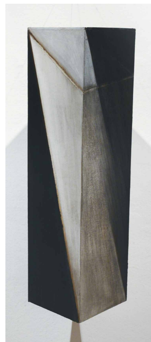
Schmal Károly Hasábok, 2001, akril, vászon, fa, 100 x 25 x 25 cm

a történést. Pszeudo-terekből, megtört szegletekből álló, eszköztelen, szinte néma romantika ez: majdnem fekete-fehér, sok esetben szürke világok, esendő vizuális entitások. A győri tárlat második termében egy nagyon ősi toposznak, a tenger végtelenségének, távoli horizont által kettéosztott tér-távlatoknak a gyúrt-hajtogatott képei sorjáznak. Mintha valami megfogalmazhatatlan odaátról származó régi képeslapok lennének a geometria és a metafizika Schmal-i szótára alapján újrafogalmazva, újraküldve. Itt meggyőződhetünk arról, hogy Schmal munkássága az idő stációinak szikár kimerevítéseit rögzíti, geometriája a kétely és keresés felől tart a bizonyosság és a hit felé: nem az állandóságot, hanem az állandóság iránti szomjúságot modellezi. Így a Teremtés könyvének egyik legkényesebb tényezőjét, a Tudás fáját faggatja, fel-felnyitja a scriniumot, megsebzti a síkot, minduntalan téri bizonytalanságokba juttatja önmagát és a nézőt.