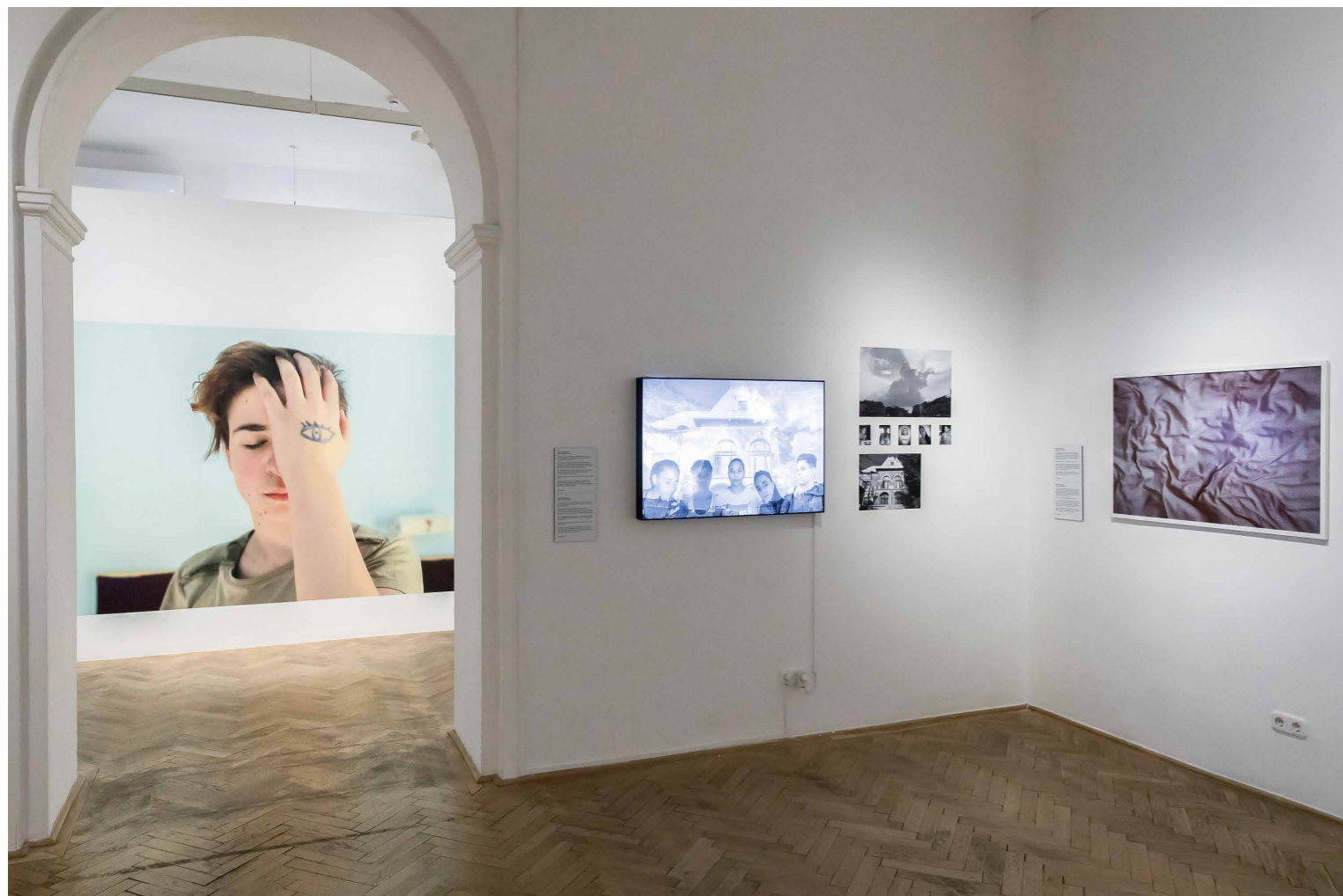
KÉP-ÉLMÉNY | Capa Központ, 2018, részlet a kiállításból

tanulságos és formailag is izgalmas élményt nyújtanak a befogadónak.