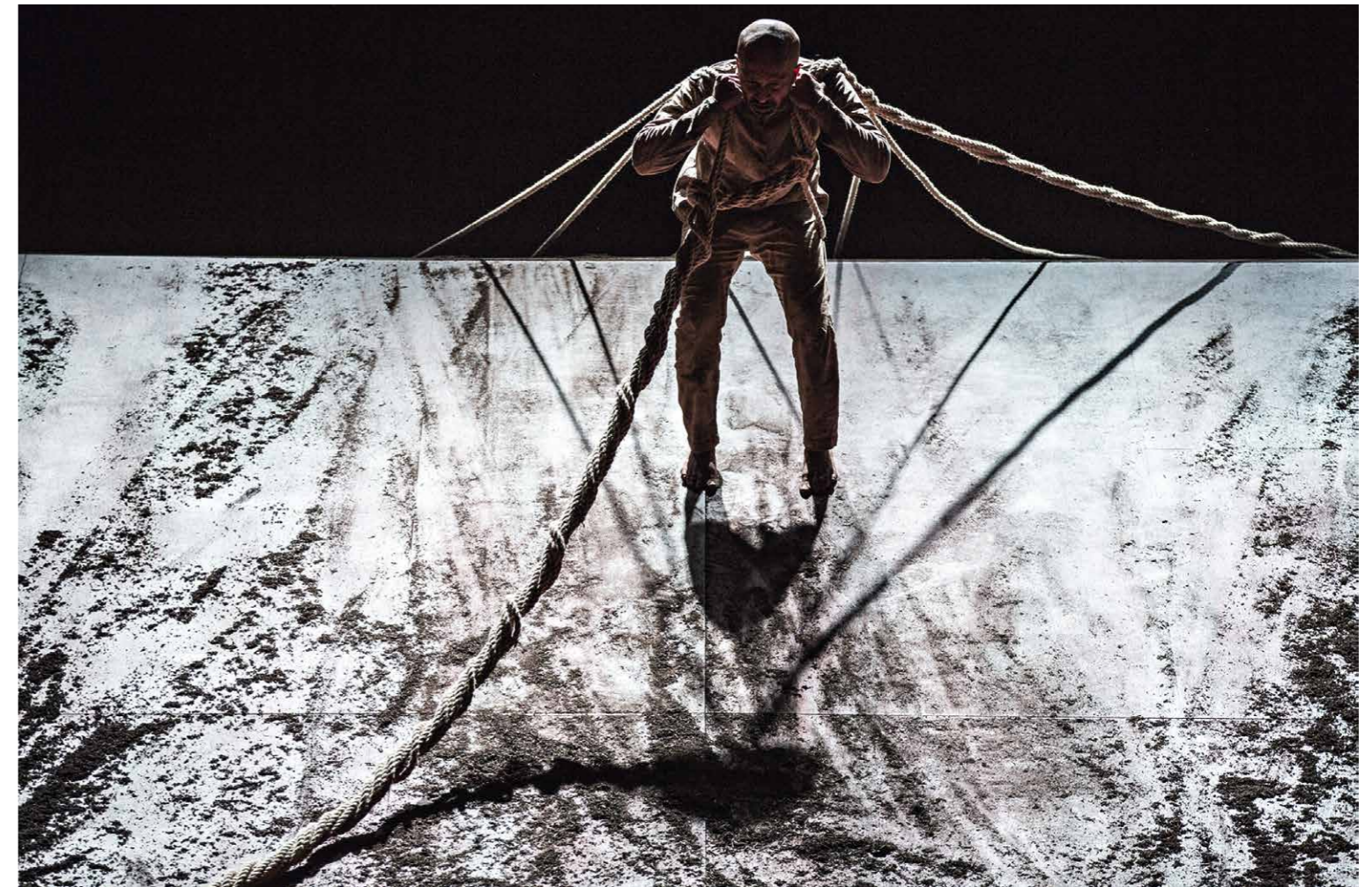
Akram Khan Company Xenos