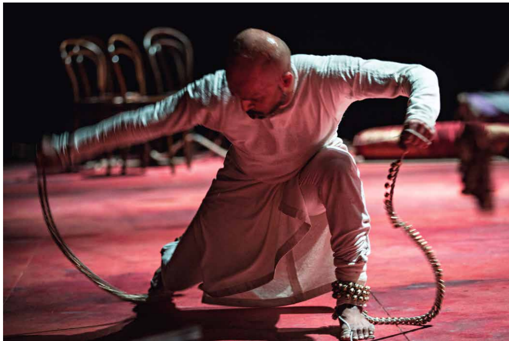
Akram Khan Company Xenos