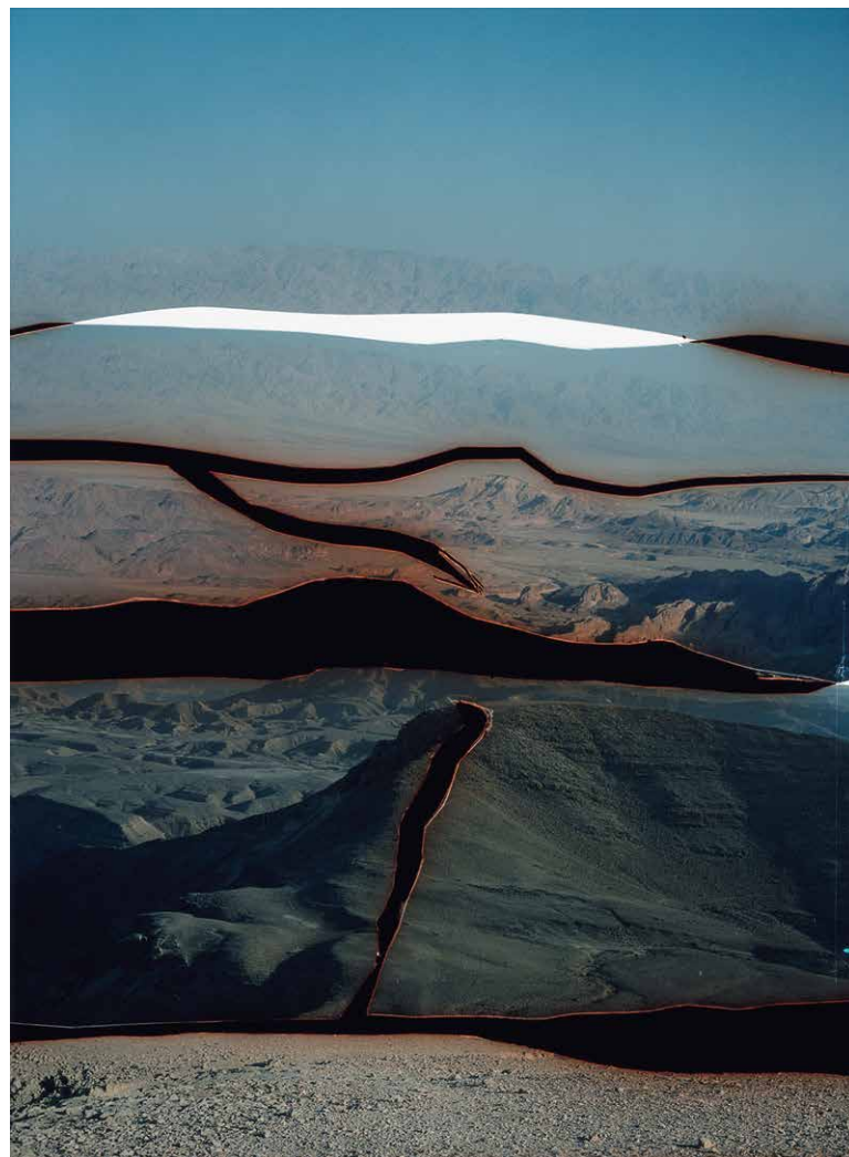
Dafna Talmor Cím nélkül, 2015