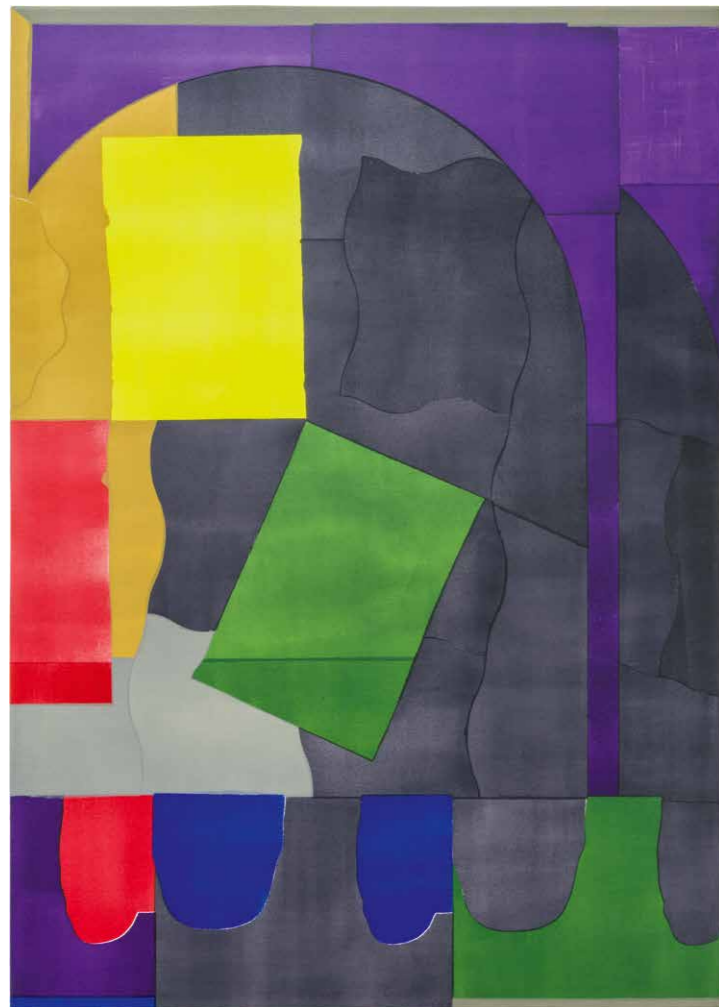
Szinyova Gergő Cím nélkül (Kényelmetlen), 2018, akril, vászon, 100 x 70 cm