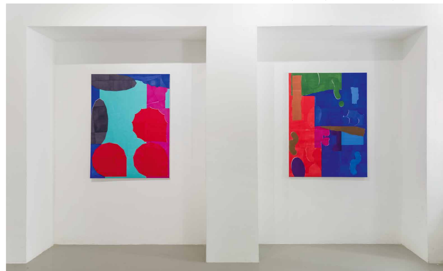
Szinyova Gergő Kényelmes / Kényelmetlen, Kisterem, 2018 | részlet a kiállításból