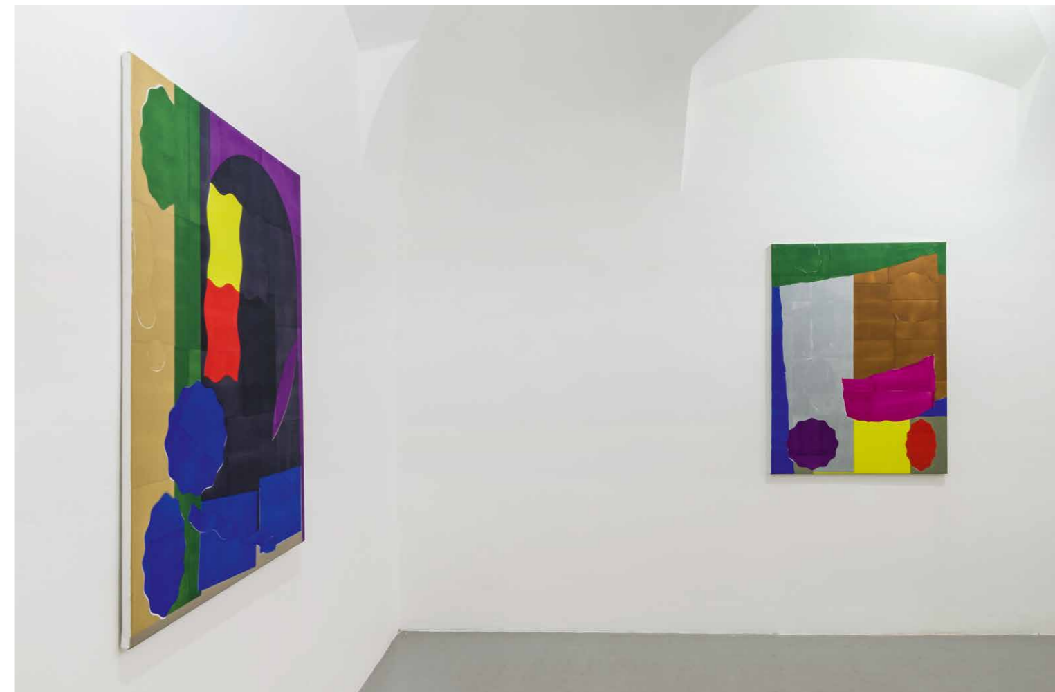
Szinyova Gergő Kényelmes / Kényelmetlen , Kisterem, 2018 | részletek a kiállításból

Nemcsak a termélységek, távolságok és közelségek érzékelése miatt, hanem azért is, mert a polikrómia ezúttal a Szinyova által alkalmazott monokrómia ellenpontjaként jelenik meg, és ennyiben a festészet történeti dimenzióira, a monokróm festészet hagyományaira, a festészet Alekszandr Rodcsenko által bejelentett végére is utal. A képsorozat darabjai a korábbi fekete képek dialektikus ellenpárjainak tekinthetők: a szintelent felváltja a színes, a szögletest a gömbölyded, a szabályos formát az amorf – olykor „pixelesedő” – alakzat. Szinyova ugyanakkor mégsem mond le teljesen a monokrómiáról, hiszen új festményein minden színmező továbbra is monokróm. A festmény monokróm képek polikróm kollázsa. A kollázs ezúttal nem szó szerint értendő, mint Henri Matisse cut-outjai esetén. Festményeket látunk, amelyek nem-festészeti eljárásokat idéznek: elsősorban a kivágást és a nyomtatást. A „cut”, a „paste” és a „print” parancsát ezúttal egyesíti egyetlen parancs: a „paint”. A monokrómia és a szintelenség a kezdetektől (a grisaille -tól) fogva a festészet peremterületeire, kereteire, ha úgy tetszik,