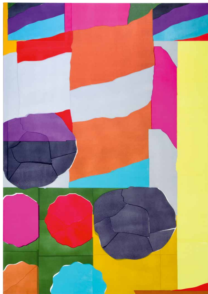
Szinyova Gergő Cím nélkül (Ugyanakkor), 2018, akril, vászon, 130 x 90 cm

végző határait utalt. Szinyova polikrómiává váló monokrómiája pedig ekként a véget nem érő vég mintázataként is leírható.