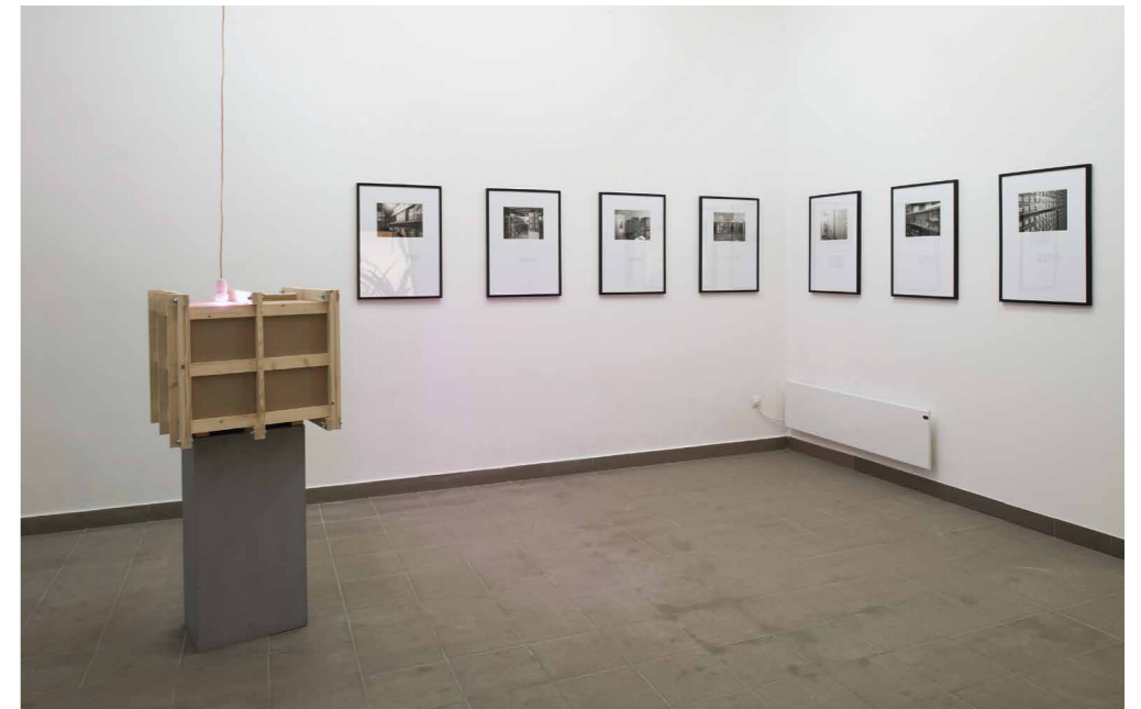
Farkas Dénes Látható Sötétség, 2018, kiállítás enteriőr

A kiállítás legizgalmasabb része az a hét kép, ahol a fotók találkoznak az idézetekkel, hiszen a látvány és a verbalitás erősíti egymást, ugyanakkor valóságos értelmezési lehetőségeket is adnak. A képeken papír- és kartondobozok, műanyag kannák, zöldeges rekeszek, lefóliázott tételek sorakoznak polcokon, fém állványokon. Minden egység számozott, arab vagy ciril betűkkel feliratozott. Totális kontroll alatt működnek az intézmények anyagai, hiszen a megőrzésre szánt magok tárolóit időnként kinyitják, mintát vesznek belőlük, elültetik, hogy teszteljék azokat. (Ennek eredményét láthattuk a nagyméretű színes fotón.) Amennyiben nem működik a dolog, akkor újra begyűjtik-pótolják a sérült, életképtelen magvakat, tehát az egész rendszert forgásban tartják. A fekete-fehér fotók alatt futó angol nyelvű idézeteket – melyek felülírják, adaptálják és átértelmezik a képeket – hadd fordítsam ide, mivel egyenértékűek a képekkel: „Mindannyian megpróbáljuk kimagya-