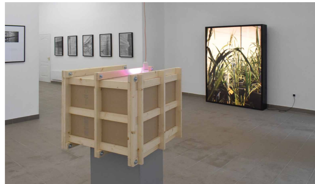
Látható Sötétség, 2018, kiállítás enteriőr

Ugyanakkor a kiállítás koncepciója következetes, majdnem hibátlan. A kiállítás üzenete szofisztikált, lélekemelő. A kiállítás látványvilága viszont steril, másodlagos. Számomra csak egyetlen kérdés maradt hátra: az Armageddon után lesz-e még emberi kéz, ami el tudja iltetni ezeket a magokat?