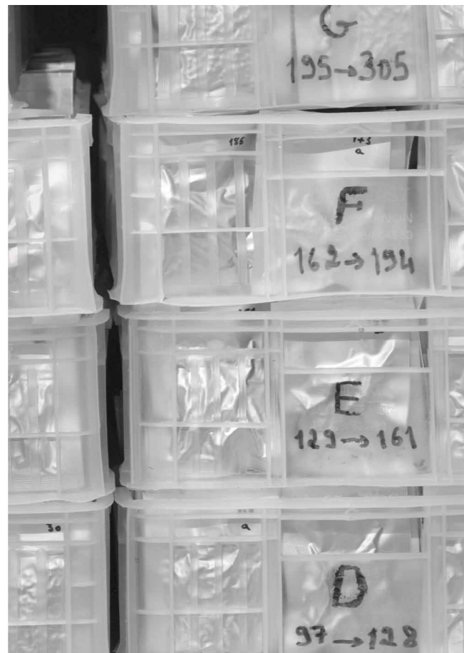
Farkas Dénes How-to-calm-yourself-after-seeing-a-dead-body Techniques, 2017, offset print, 50x70 cm, 1/5 + installation example