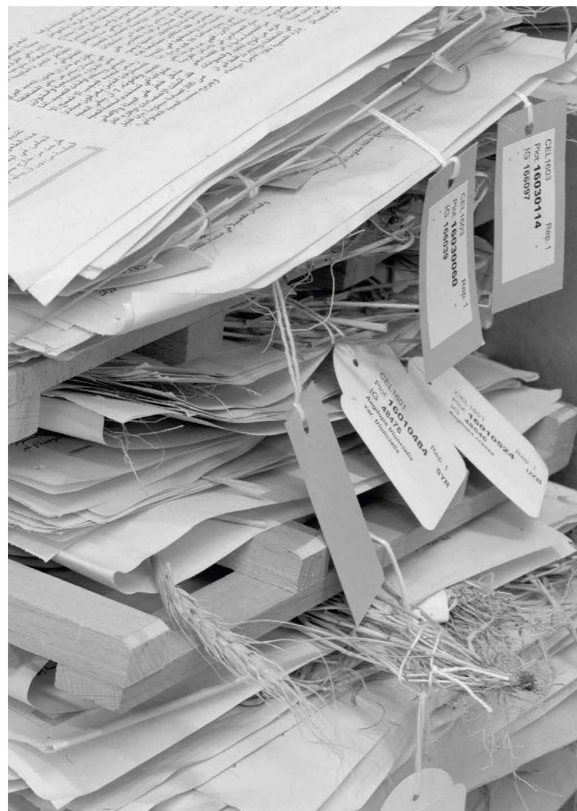
Farkas Dénes How-to-calm-yourself-after-seeing-a-dead-body Techniques, 2017 offset print, 50x70 cm, 1/5 + installation example