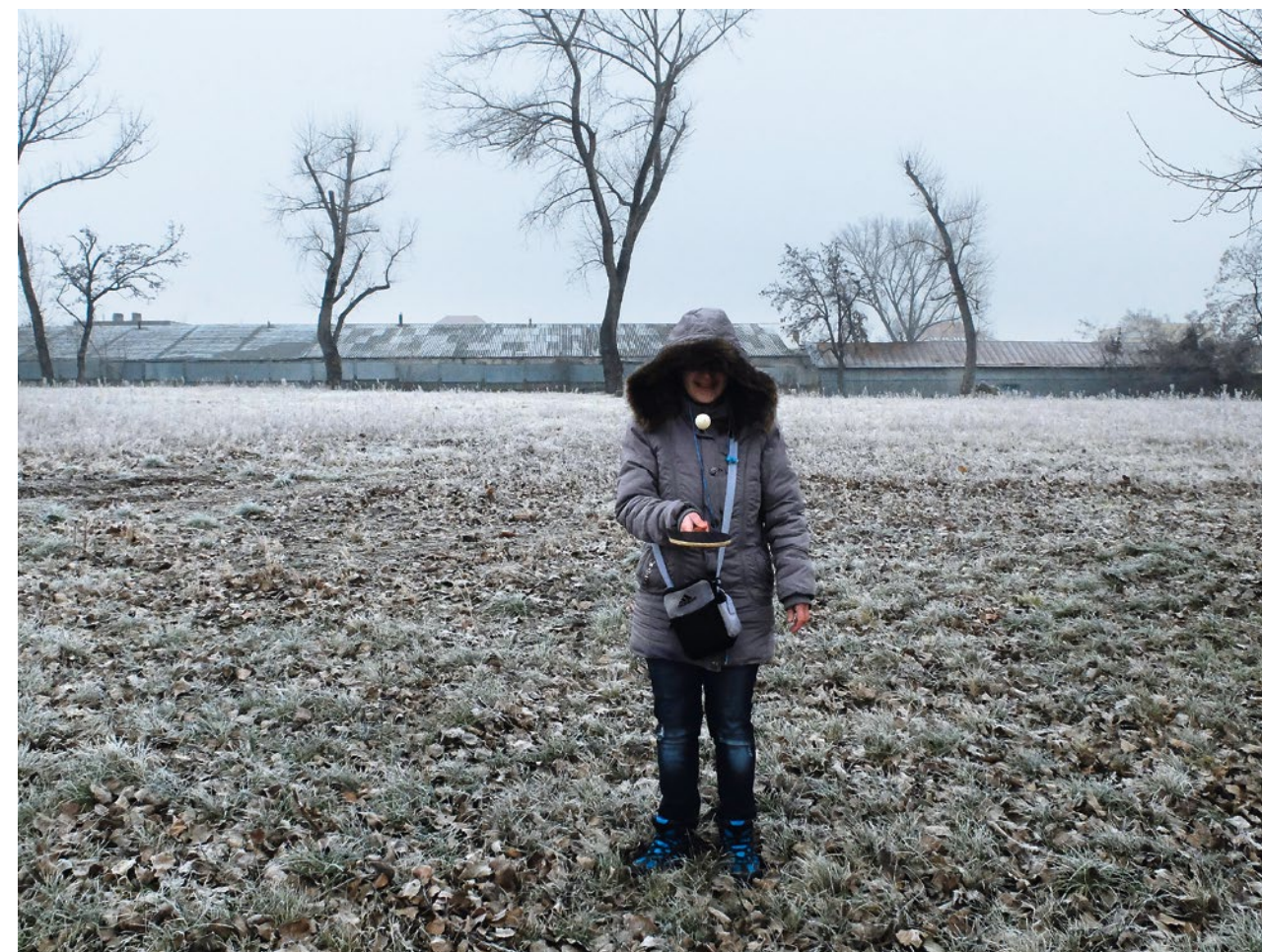
ÖZE ESZTER a szöveg megírásakor ELTE rendszeres művészeti ösztöndíjában részesült.