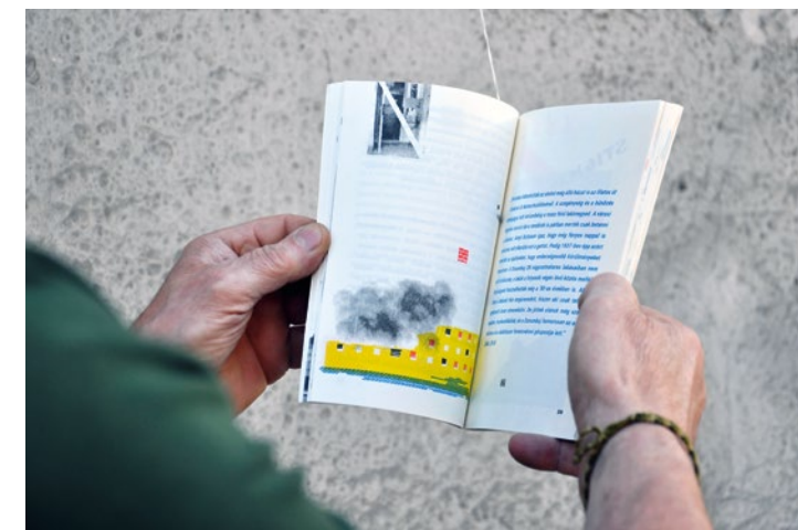
Balla Csöngye A város peremén kiadvány, 2017