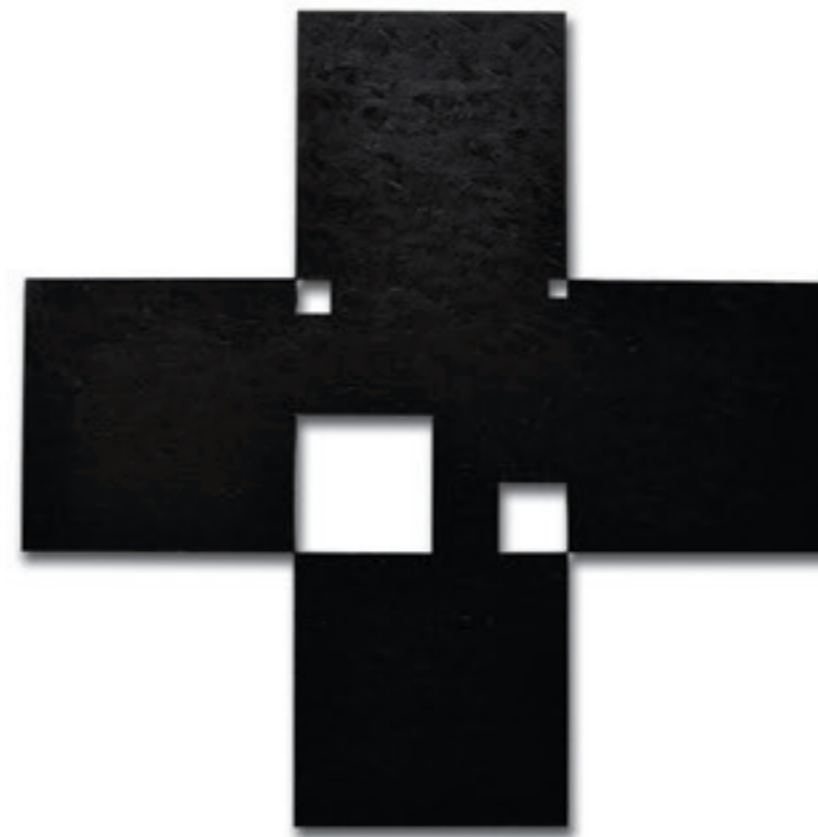
SAXON Szász János Malevics-kereszt polidimenzionális űrökkel, 2010 olaj, kasírozott vászon, 111 × 111 cm

kényszerítik a nézőt, hogy belenézzen azokba, milyen űrök is nyílnak az egykori tömbökben. A trükk, az igazi átlényegítés pedig annyi, hogy a kocka hibátlan formáját megtörve, csonkolva, többletjelentést képes adni a műveinek. A kevesebb többé válik, az elvétel, a minimalizálás folyamata a visszajára fordul: gazdagabbá válik a felület és az egész test. SAXON-Szász Homo Ludens-ként következetesen és koncepciózusan játszik.