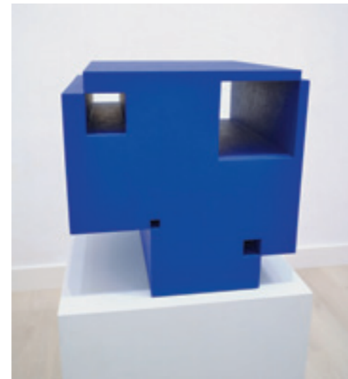
SAXON Szász János Űr-Kocka III., 2015 olaj, tömörített fa, 33 × 33 × 33 cm