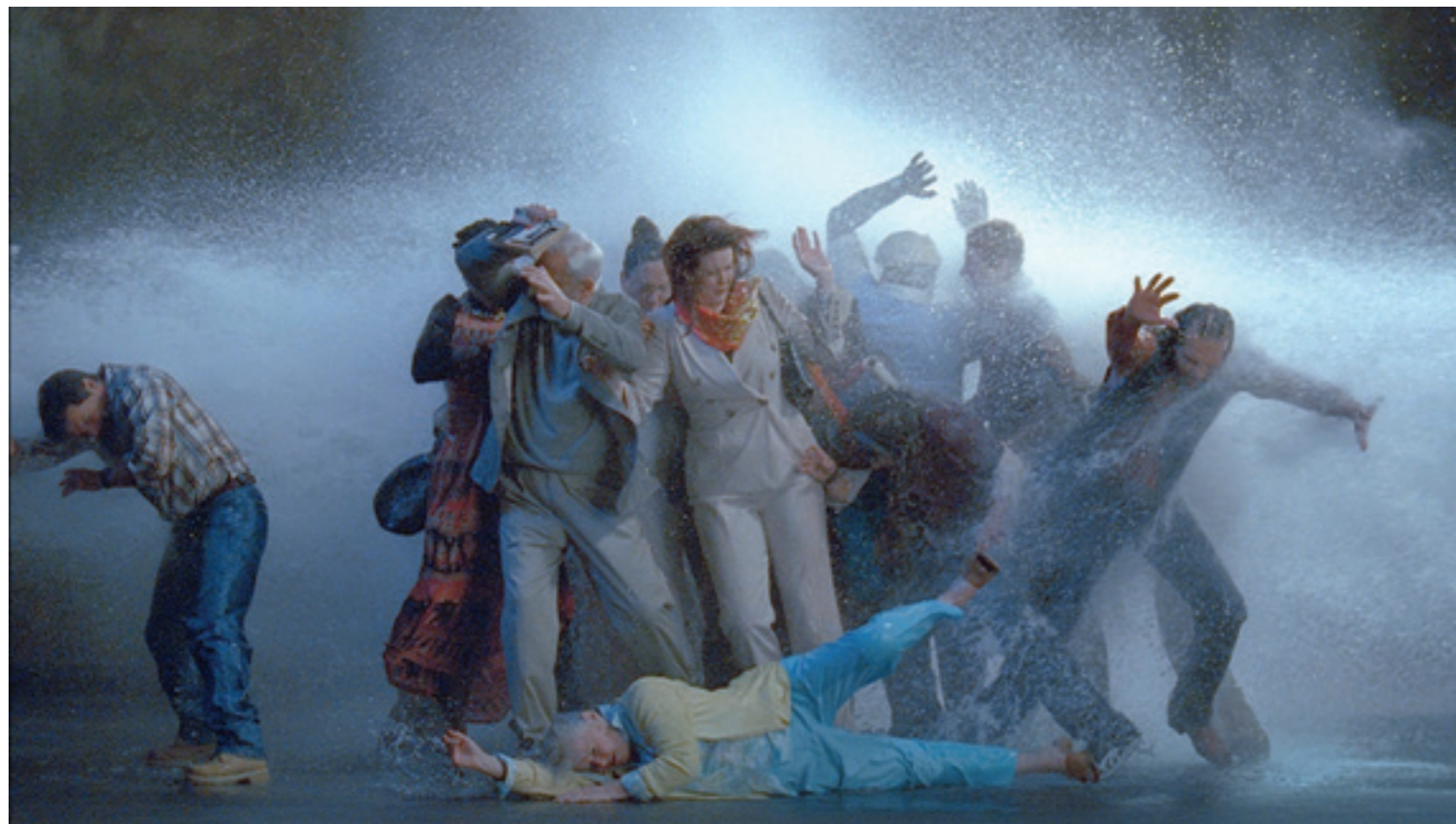
Bill Viola Vihar (Tanulmány a tutajhoz) | Tempest (Study for The Raft), 2005 videó (LCD panel: 66×109×10,2 cm), 16' 50"

kibontakozó jelenségként, az élet titokzatos változékonyságában megjelenő egzisztenciális kérdéseként tesz jelzéseket. Az emberen, emberi mozdulatokon, cselekvéseken keresztül jeleníti meg a sejtethőt, a megfoghatatlant úgy, hogy az ember ennek a szentségnek nincsen tudatában, de szükségszerűen kénytelen valamiféle nagy elemi erő terében lenni, cselekedni. A tapogatózó, utat kereső emberi önreflexió LUCAS CRANACH – szemtől szemben hihetetlenül gyönyörű – remekművére (Ádám és Éva, 1528) reflektáló két videóinstalláción – A férfi a halhatatlanságot keresi , A nő az örökkévalóságot keresi ( Man Searching for Immortality / Woman searching for Eternity , 2013) – is megjelenik, felmutatva a nemek hasonló, de mégsem egyforma viszonyulását önmagukhoz és az élethez. A két közvetlenül egymás mellett futó videó fintora, hogy amíg Cranach festményén Ádám és Éva egymásra pillant, itt a férfi és a nő teljesen elkerüli egymás tekintetét, mintha tudomást sem vennének a másik létezéséről: „önmagukat keresik”, fizikailag egymás mellett vannak, de még sincsenek egymáshoz közel. Az öntükröződés, az ember – zsákutcába jutott – narcisztikus önmaga keresésének videója a Megadás / Lemondás ( Surrender , 2001).