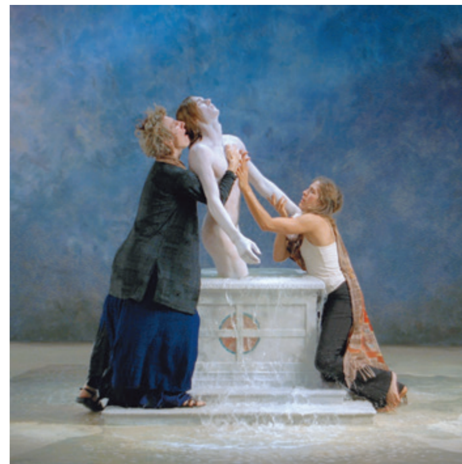
Bill Viola Felemelkedés / Kiemelkedés | Emergence , 2002, videó (falra szerelt vetítőfelület: 213 × 213 cm), 11' 40" (Performers: Weba Garretson, John Hay, Sarah Steben), Courtesy Bill Viola Studio

A kiállítás első videója, Az átkelés rögtön lényegre törő összefoglalás, de egyben az utalások nyitánya is: az egyik oldalon tűzben eléggő ember feltámadása a másik oldalon vízben – mindez egy vetítövászon két oldalán megjelenítve. A művész a szakralitásra érzékenyen, utalásszerűen, a háttérben