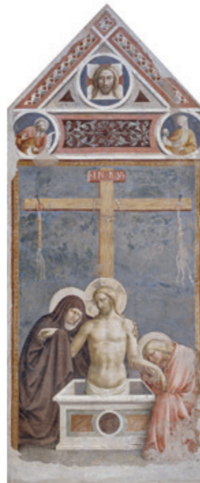
Masolino da Panicale (Tommaso di Cristoforo di Fino; Panicale di Renacci? 1383/84–1435.k.) Pieta , 1424, áthelyezett freskó, 280 × 118 cm, Museo della Collegiata di Sant'Andrea, Empoli (inv. n. 32)

megrendítő eseményeket mutatnak be, olyan világot, ahol az ember, aki egyszerre gyanútlan és óvatlan, sejtéseiben mégis tudja, érzi az előszelét a váratlan katasztrófának, amelyeknek kiszolgáltatott, de amelyeket túlél, hogy újrendezze, ismét újrakezdje életét. Az emberi mozgásokon kívül a gesztusok, a mimika is nagy jelentőséget kapnak az installációk megjelenítésében, s az is lenyűgöző, ahogy egy-egy a festményeken látható tárgy, vagy alak megmozdul, megelevenedik: így például a Masolino-festmény sírköve és figurái, amint Krisztus fehér alakja elkezd lassan kiemelkedni a sírból. Viola a képzetet valóságossá alakítja a jelenet elevenné tételével, de úgy, hogy mindeközben az emberi élet szent voltára is folyamatosan utal a hagyományos toposzok sajátos újraírásával, pontosabban újraképezésével.