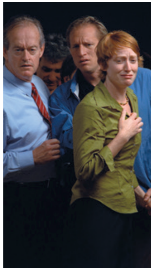
Bill Viola Megfigyelés | Observance, 2002, videó (plazma-tv: 120,7×72,4×10,2 cm), 10'14"

Lehetséges, hogy a reneszánsz – legalábbis belső világunkban, szerteágazó emberi viszonyulásainkban és tága(sa)bb kapcsolódásainkban – talán nincs is olyan távol tőlünk, mint ahogy mai mindennapjaink és hétköznapi gondolkodásunk a felületen megjeleníti? Ezt a kérdést ez a kivételes, párhuzamos reneszánsz-kortárs művészeti kiállítás több szempontból is felveti, amint azt nemkülönbön Bill Viola időközön átívelő, Pontormóhoz intézett szavai is, amelyeket 2013-ban, a festményt restauráló Daniel Rossi műterem látogatói naplójába jegyzett be: „Pontormo Mester, Köszönöm az Inspirációd és a Szellemed. Örökre hálás vagyok mindazért, amit kaptam tőled. Nagy mester vagy! Szeretném megmutatni neked a munkáimat mozgó képekkel. Alig várom, hogy találkozzunk a Mennyben, a Művészek szekciójában. Hálával és tisztelettel, Bill Viola.”