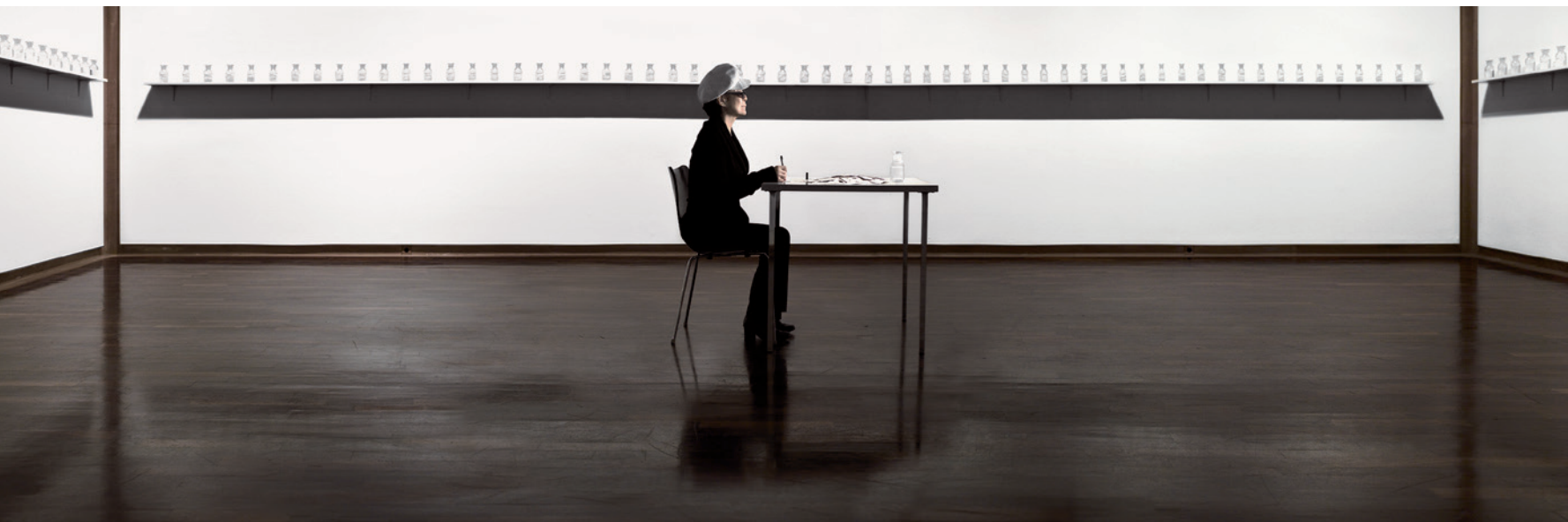
YOKO ONO We are All Water 2006. Kunsthalle Bielefeld, 2008

kiállításán 1961-ban, Paintings & Drawings by Yoko Ono címmel, korábban megfogalmazott instrukciói, rendelkezései alapján készített festményeit mutatta be George Maciunas New York-i galériájában, 1962-ben Tokióban viszont már csak az instrukciókat. Ez utóbbi esemény volt a konceptuális művészet egyik legelső nyilvános megjelenése. A közönség akkor, akárcsak most Lyonban, képek helyett rendelkezésekkel találta szemben magát. „Festményeim rendelkezések, és arra vannak hivatva, hogy mások hozzák létre” – vallja Ono, és ez történhet akár tárgyasult formában, akár képzeletünkben. 1964-ben Grapefruit címmel könyv alakban is megjelentette konceptuális instrukcióinak gyűjteményét, amit egyes kritikusai kottáknak, mások költeményeknek tartanak. Az első instrukciók, mint a „mosolyogjon egy hétig” vagy a „köhögjön egy évig” az ötvenes évek első felében születtek. A későbbiek ennél összetettebbek és vizuális aktivitásra invitálnak: „Hó helyett fehér márvánnyal beborított kert, a márvány hasonlít a hóhoz, de ezt nem lehet megállapítani, csak ha leszedjük a márványréteget.” „Egy papírgombóc és egy márványból készült könyv, a végső változatban egymásba fuzionál a két tárgy, de ennek létrejötte csak a fejünkben sikerülhet”, avagy „márványgömb,