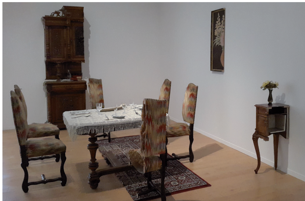
YOKO ONO Half-A-Room, 1967/2016

ami képzeletünkben fokról fokra olyan hegyes kúppá alakul, hogy egy bizonyos pillanatban elnyúlik a helyiség túlsó végéig”.