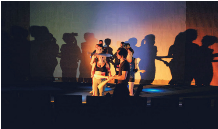
KARCADE COMPANY Kékpárduc, 2015. június 20., Ludwig Múzeum – Kortárs Művészeti Múzeum

középpontba. Klözö több soron bénázik, ezért nyomozása kudarcba fullad, persze, hogy a kollégák is cseszegetik, ráadásul a család sem nyújt számára menedéket. Ne várjon senki happy endet! Egy nevetséges karambolban végződik a történet. Klözö autójára kamionnyi kismalac zúdul.