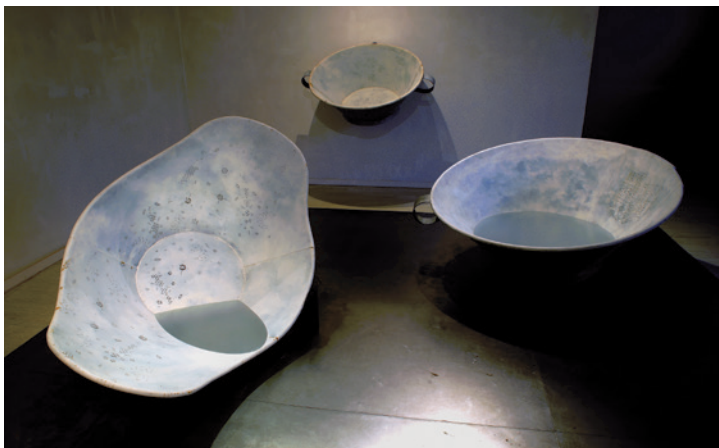
SZANYI BORBÁLA Csendes napok I. III., 2013, 2014 (részlet)

A csipkés ellenére a dézsák egyszerűek, szinte falusi miliőt idéznek, egy már nem is létező (napjainkban talán csak Erdélyben valamelyest fellelhető) életérzést. Ez az egyszerűség, jellegéből fakadóan, letisztultságot is jelez. A múlt eme megéledt relikviái emiatt tehetnek szert új jelentőségükre, ezzel a minden fölösleges formai túlkapást mellőző, funkcionalitás által meghatározott dizájnnal. De összességében is puritán, érzékeny fogalmazásmód jellemzi a kollekciót és különösen szimpatikus, ahogyan a nőiség megjelenik ezekben (mű)tárgyakban (egy, talán egyszerűbb világ attribútumaiban), hogy bár a felhasznált formák és háztartási eszközök a hagyományos női szerepeket idézik, mégis olyan természetességgel, ami teljesen független marad bármiféle nő-, illetve genderművészeti irányzat „egyénosványától”. Abszolút egyénien, őrizve és áttemelve a múltat a jelenbe.