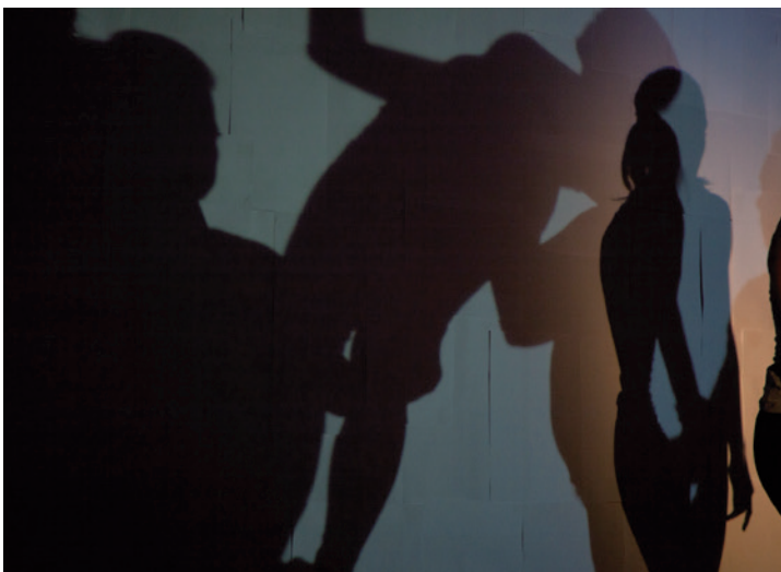
KARCADE COMPANY Kékpárduc, 2015. június 20., Ludwig Múzeum – Kortárs Művészeti Múzeum

A történetet, s vele Klözö vesszőfutását az artisták mozgásgyakorlatai szakítják meg, de szó sincs a pályára szaladó pom-pom lányok sekélyes magamutogatásáról. A filmszereplők megelevenednek, a produkció a valós művészi szintérré helyeződik át. És innen Klözö élete, lehetőségei és drámája csak egy nehezen verbalizálható szimbólumrendszerben tárgyasul. A néző szívesen elmélázna az összehangolt, harmonikus mozgássorokon, azok árnyjátékán, a gravitáció ellenében dolgozó kunsztokon, a máskor vicces vagy groteszk koreográfián, sőt a legszívesebben a fiatalok közékük vegyülne. De nem teheti, még nem, mert a zene dübörög, valaki még visszatartja, ott van valahol Klözö is – a pálya szélén. Hiszen ez az előadás azt feszegeti, azt is, gesamtkunstwerkstül, miként kötheti össze magát az individuum a közösséggel úgy, hogy ez a kapcsolat egyszerre legyen emberi és hatékony. Hajrá párducok, hajrá Klözö!