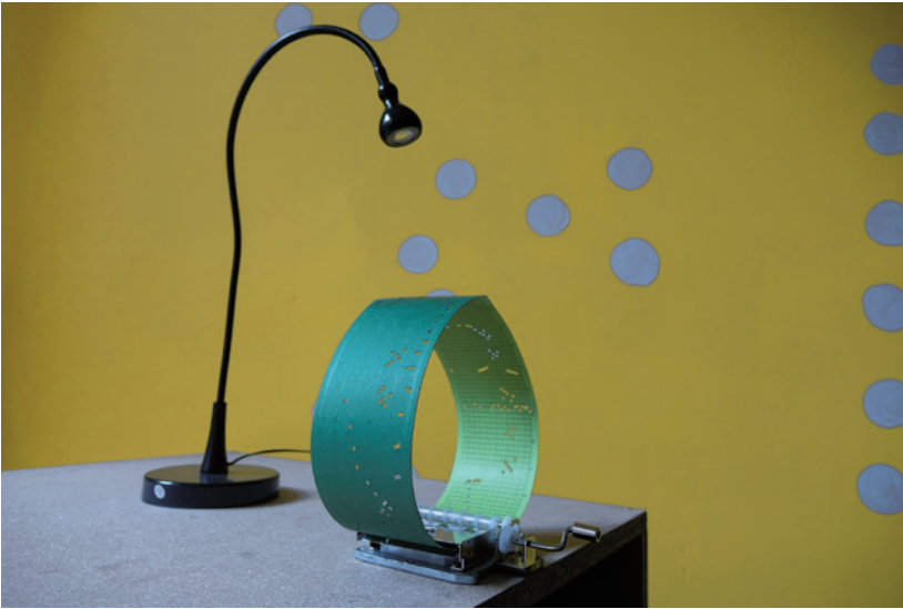
TORNYAI PÉTER Városi tücskök, 2015, interaktív hanginstalláció, (részlet) 1052 Budapest, Vitkovics Mihály u. 3., Sound as Space, OFF-Biennale Budapest