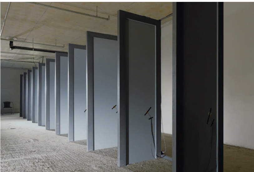
VÁRNAI GYULA Replika, 2015 hanginstalláció, (részlet) 1061, Budapest, Király u. 8-10, Central Passage, 40-es helyisége, Sound as Space, OFF-Biennale Budapest

Konzervatórium Hangtani Intézetében a hidegháborús rádióadás-zavarás esztétikai aspektusait kutatja, amely egyúttal elméleti keretrendszerként is szolgál számára installációi megalkotásában. Az ID -ben a régi, egymást zavaró rádióadásokat modellezi, miközben egy imaginárius világot alkot, amelynek fókuszában a prostitúcióról való diskurzus narratívája által elfedve, de magáról az elektromágneses kommunikációs metanyelvről és az információ változókonny természetéről, azaz az