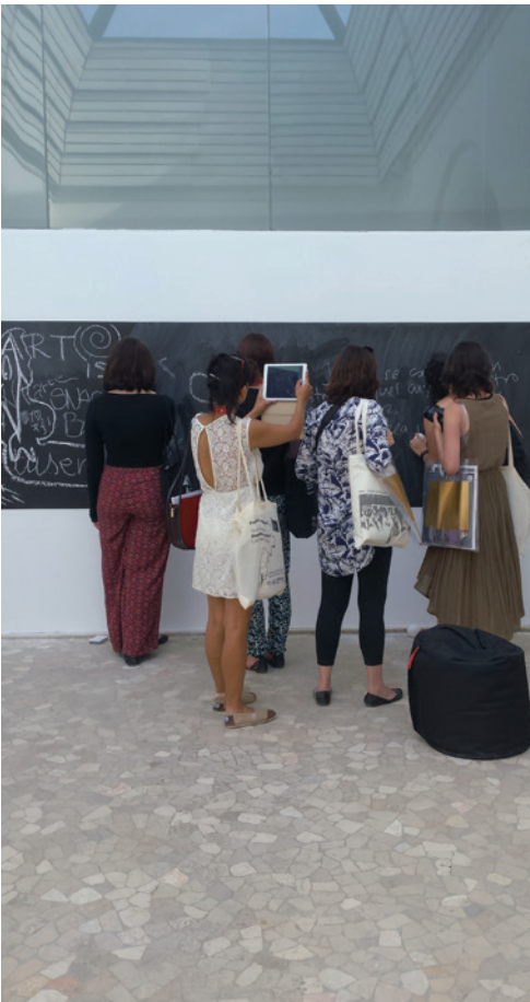
CSEKE SZILÁRD Fenntartható identitások, 2015 | 56. Velencei Biennále, Magyar Pavilon