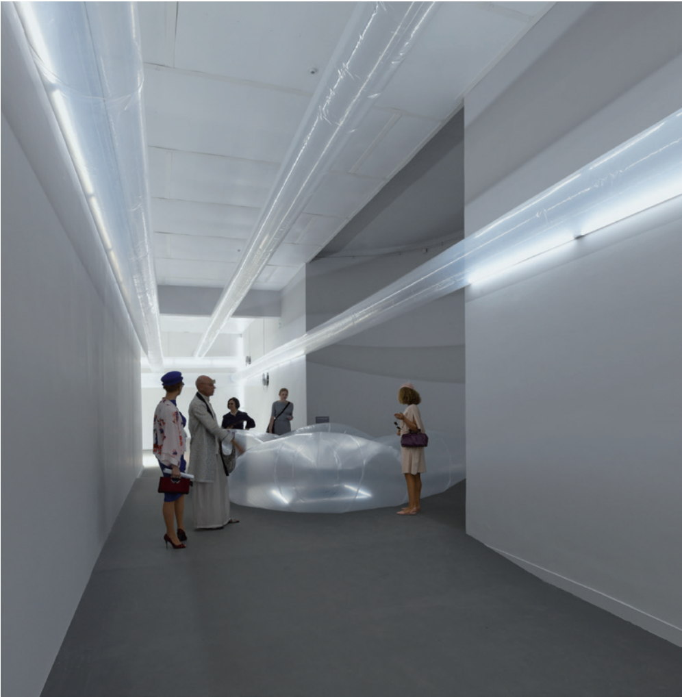
CSEKE SZILÁRD Fenntartható identitások, 2015 | 56. Velencei Biennále, Magyar Pavilon