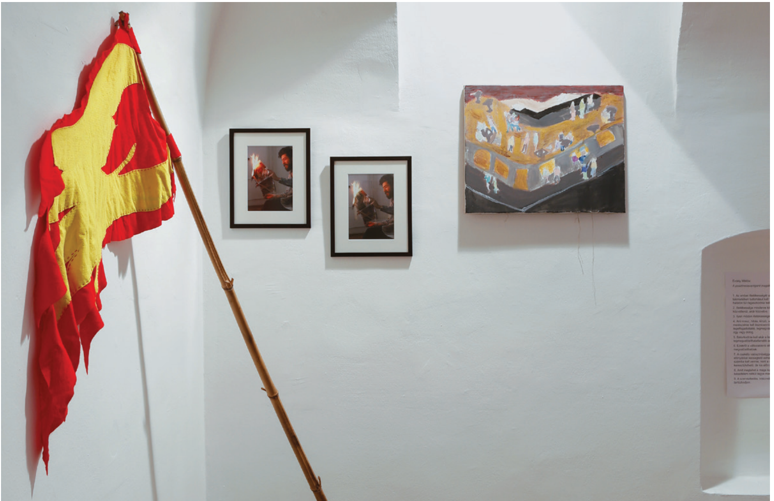
KÓTUN VIKTOR Vázlatok egy posztneovangárd arcképcsarnokhoz No. 1, 2014 (részlet)