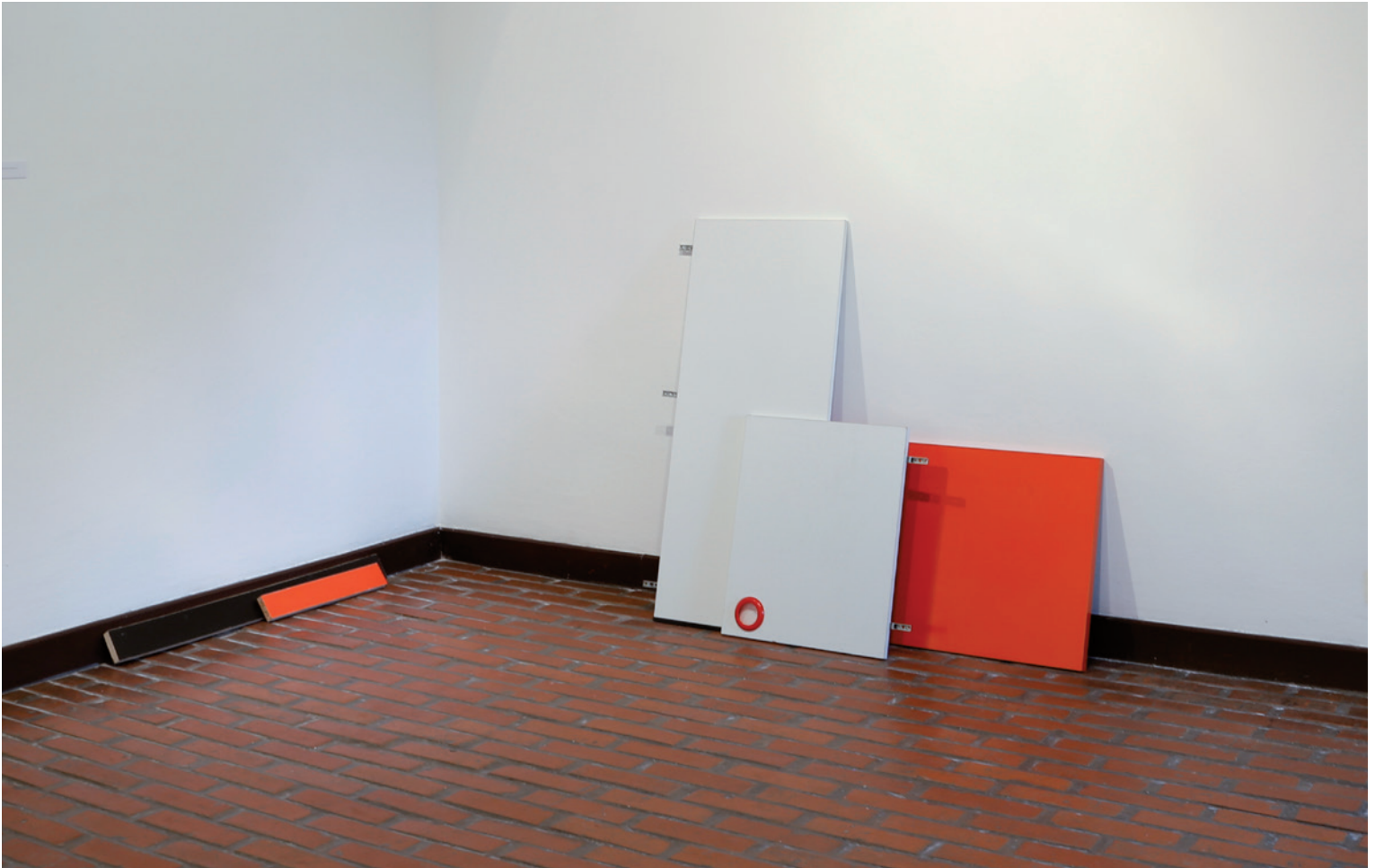
SZENTESI CSABA Cím nélkül (disszociatív formaterv), 2014 (részlet)