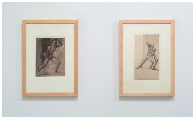
HENRY FUSELI és JAVIER TÉLLEZ Prométheusz fáklyája, 2014 Kunsthaus Zürich, részlet a kiállításról, Fotó: Lena Huber