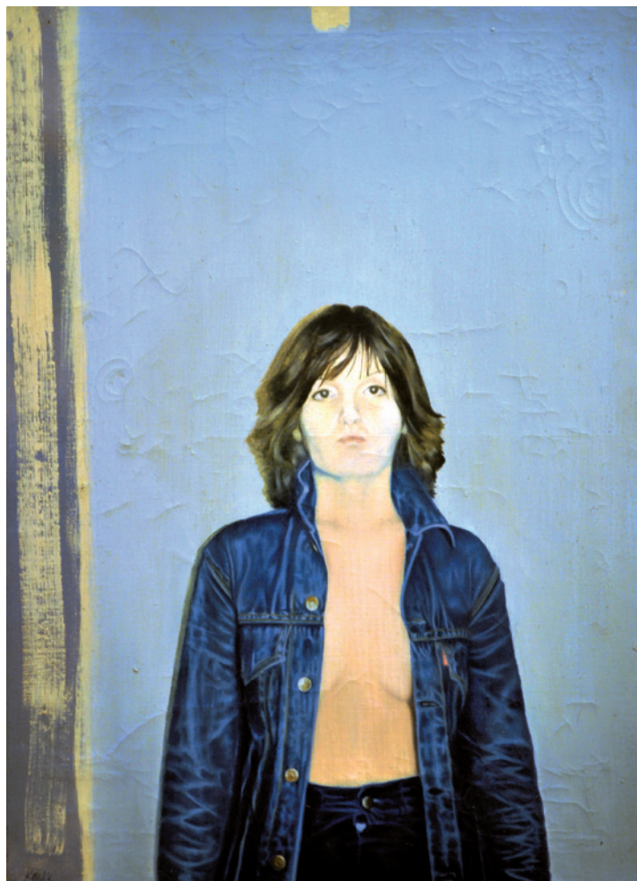
KONCZ ANDRÁS Cím nélkül (Portré), 1976, olaj, vászon, 60×80 cm