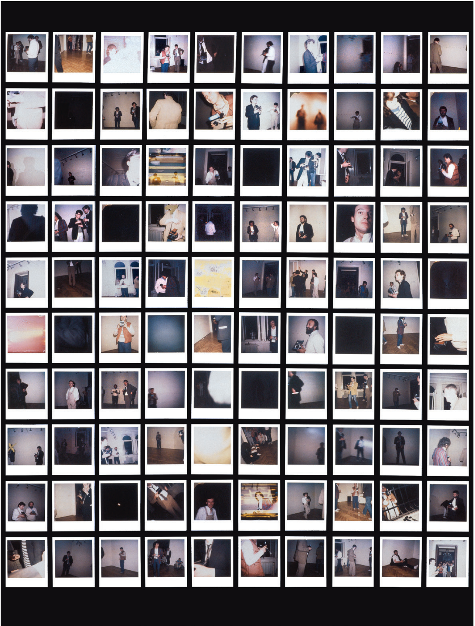
KONCZ ANDRÁS 100 kép együtt, polaroid fotók, karton, 100x120 cm