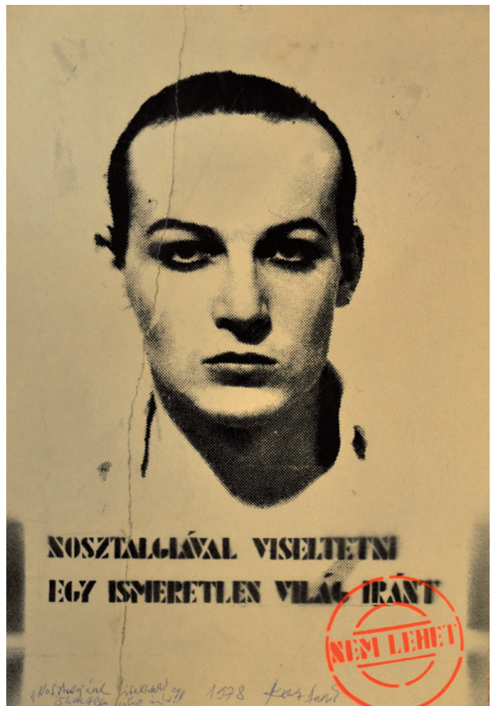
KONCZ ANDRÁS Nosztalgiával viseltetni..., 1978, olaj, szita 50×35 cm