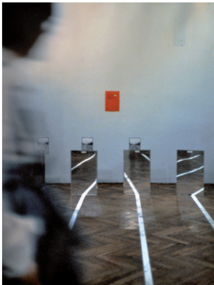
KONCZ ANDRÁS Vonaleltérítés , 1976, fotó, 40×35 cm