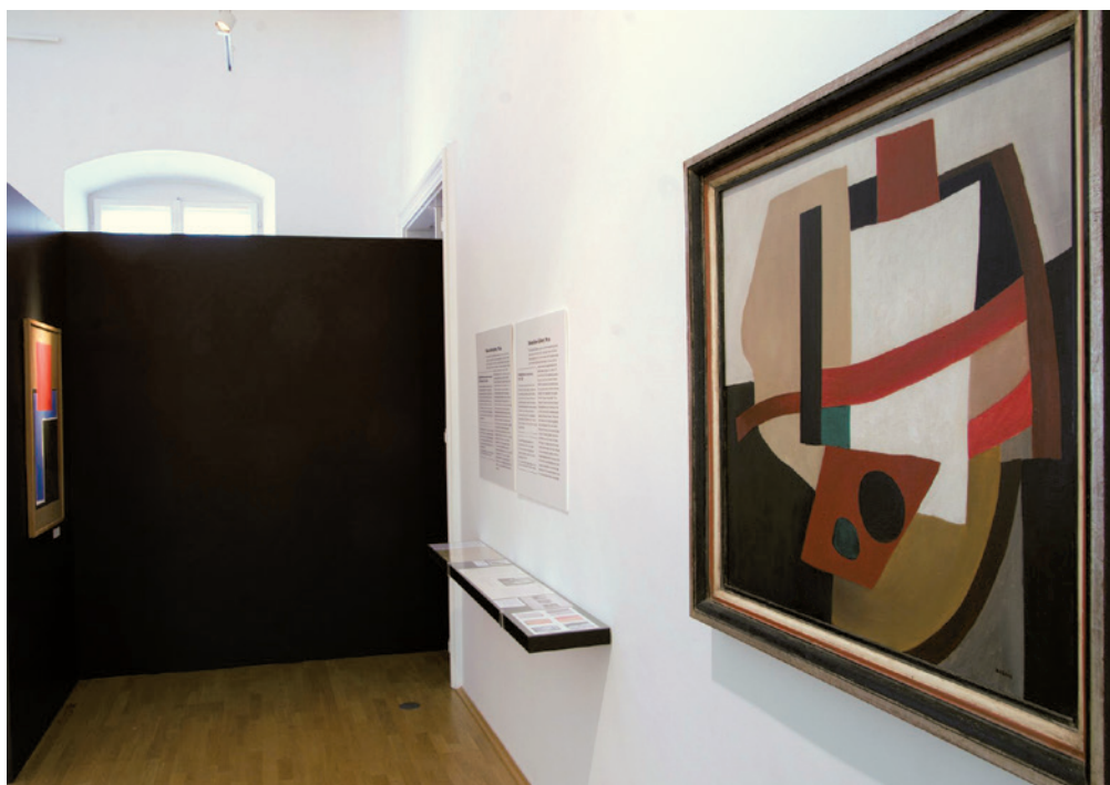
Kassák és Kassák 2. KONJUNKTÚRA és KISZORÍTÁS. Kassák Lajos nyugati karrierje és hazai megítélése a hatvanas években Kassák Múzeum, 2014, részlet a kiállításról