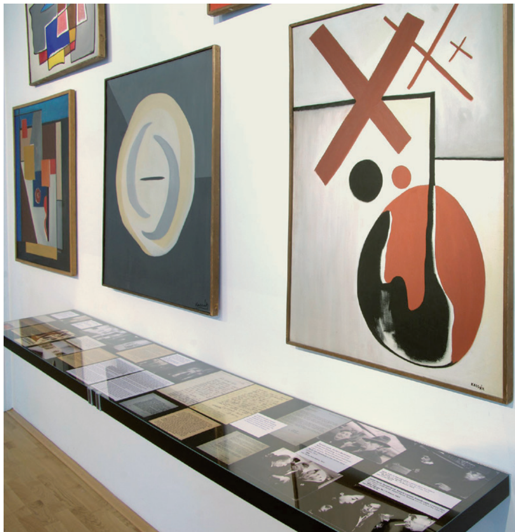
Kassák és Kassák 2. KONJUNKTÚRA és KISZORÍTÁS. Kassák Lajos nyugati karrierje és hazai megítélése a hatvanas években Kassák Múzeum, 2014, részlet a kiállításról

Kassák magyarországi helyzete pszichikailag sem volt könnyű: „A hiányérzet súlya nyom. S egyebek közt ezért írom ezt a levelet is, hogy a párizsi kontaktus töltsön el némi bizalommal a jövő iránt.” (1961.02.06.) Az elismerő külföldi kritikák mindenesetre gyógyírként szolgáltak elszigeteltségében a művész számára: „Képzelve el, hogy mindez milyen inspirálólag hat rám, aki végeredményben még mindig nem kerülhetett közvetlen érintkezésbe a határainkon túli világgal.” (1966.10.01.) Kassák azonban háttérbe szorította ellenére mindvégig tisztában volt műveinek értékével és saját jelentőségével. Ahogy a Kassák–Vasarely mappa megjelenésekor írta: „Közölt munkáim fölött negyven év múlt el s beképzeltség nélkül az a véleményem, hogy annak idején a helyes úton indultam el, komolyan vettem feladatomat és kétségtelenül némi eredményeket is elértem.” (1961.10.29.) Az idő művész meglehetősen elszánt volt, elszántagra pedig szüksége is volt, hiszen egyszerre kellett alkalmazkodnia a kortárs nyugati műkereskedelem viszonyaihoz, illetve harcolni elismerésért, kiállítási lehetőségért a hatvanas évek Magyarországon: „Én azonban olyan ember vagyok, aki nem könnyen mond le terveit megvalósításáról, terveim pedig vannak s ha csak egy