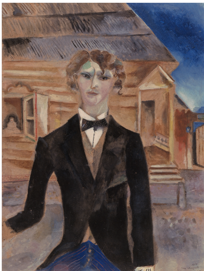
MARC CHAGALL Önarckép a ház előtt, 1914 olaj, vászonra ragasztott karton, 50,7 x 38 cm

A születési anyakönyvekbe Chagallt Moysze Szegal, Ámost Ungár Imre név alatt jegyezték be. Felőtt koruk elején mindketten megváltoztatták az eredeti nevüket. Ellentétes azonban a névváltoztatás oka. ÁMOS IMRE a zsidó közösséghez tartozását nyomatékosította, CHAGALL ezzel szemben neve átalakításával a távolodás szándékát jelentette be. A jiddis-héber Moysze helyett a semleges