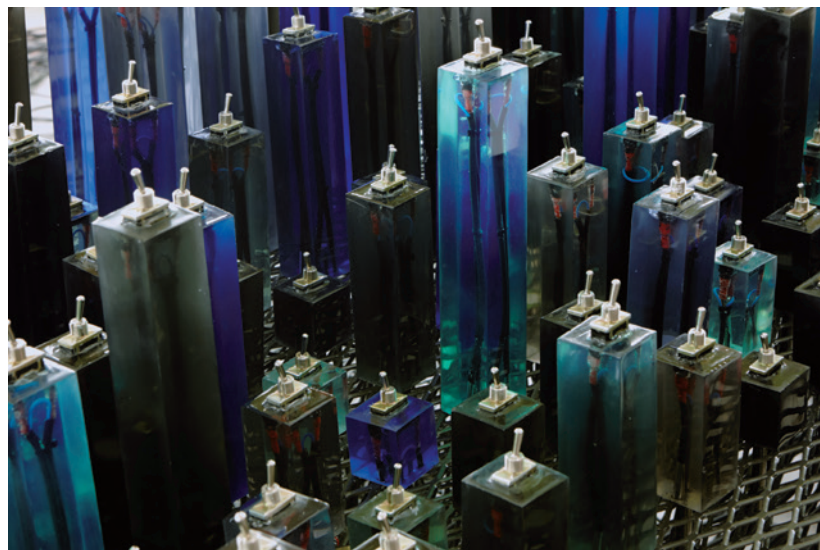
FAYE TOOGOOD The Conductor (részlet), 2013

Faye Toogood kísérletező designer. Saját stúdiója (Studio Toogood) belsőépítészettel, fotósorozatokkal, divatrendezvények látványtervével foglalkozik, de mindenekelőtt helyspecifikus kísérletekkel, mint például amilyen a 2012-es milánói Design Fair-en bemutatott La Cura installáció volt, valamint a londoni fesztiválon szerepelő projektjei ( The Back Room , 2012; Super Natural , 2010; The Hatch , 2009; Corn Craft , 2009). 7 A stúdió saját nevével fémjelzett, egyedülálló design-tárgyai és nagy sorozatszámú bútorai különböző anyagokból készültek: gyantából, bronzból, kézzel faragott fából. Egyes projektek közös bemutatása, a kész design-objektok és munkák olykor egy önálló environmentet alkotnak. Ezek az összehangolási kísérletek Toogood szerint innovatív kommunikációs utakat nyitnak meg újabb koncepciók felé. 8