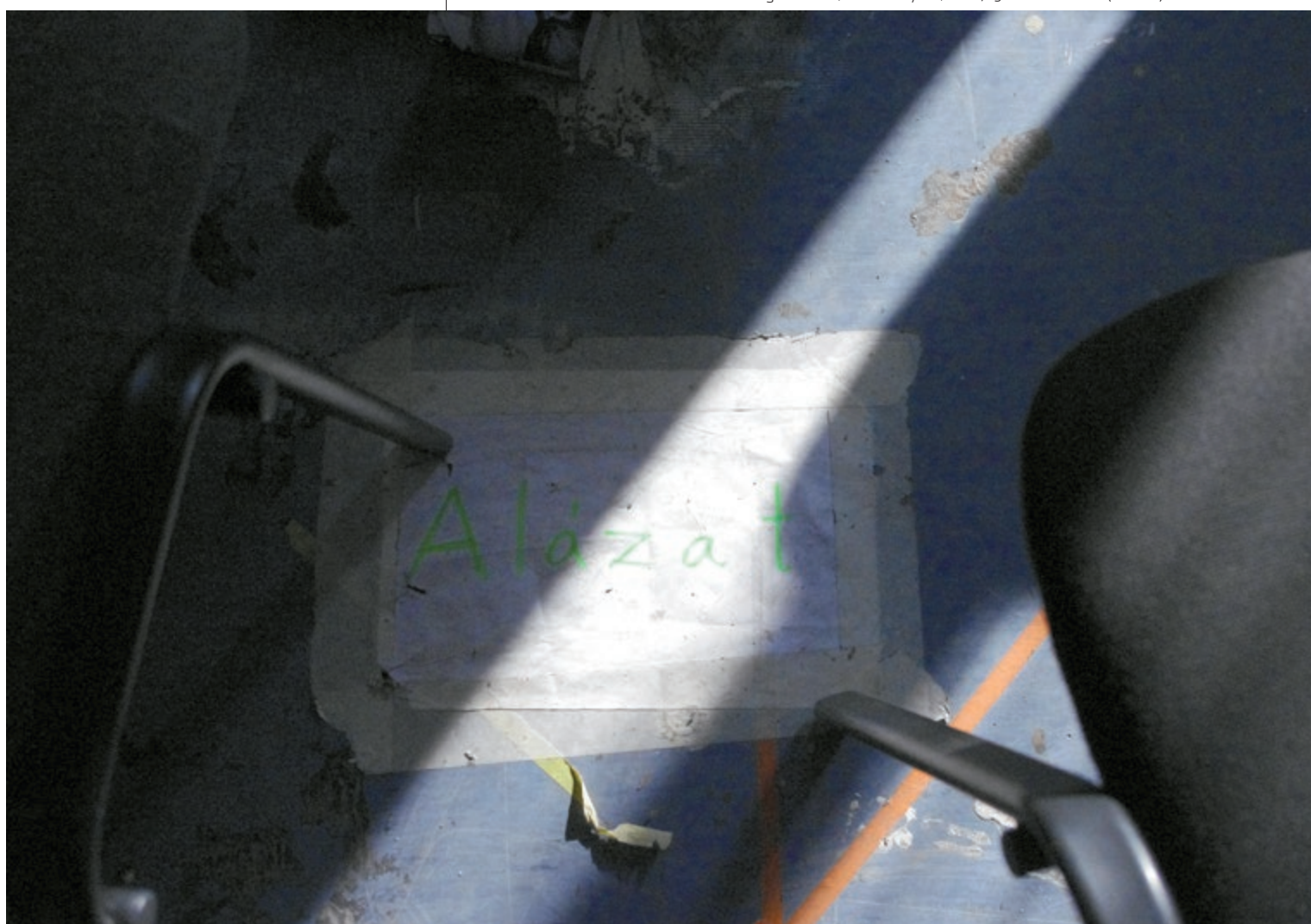
Interaktív és kollektív fogalmi háló, I. II. évfolyam, 2012/13 második félév (részlet)