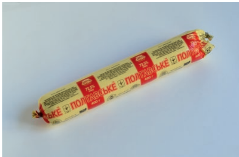
Ukrán vaj

* Mucsi Emese az MKE Képzőművészeti elmélet szak végzős hallgatója