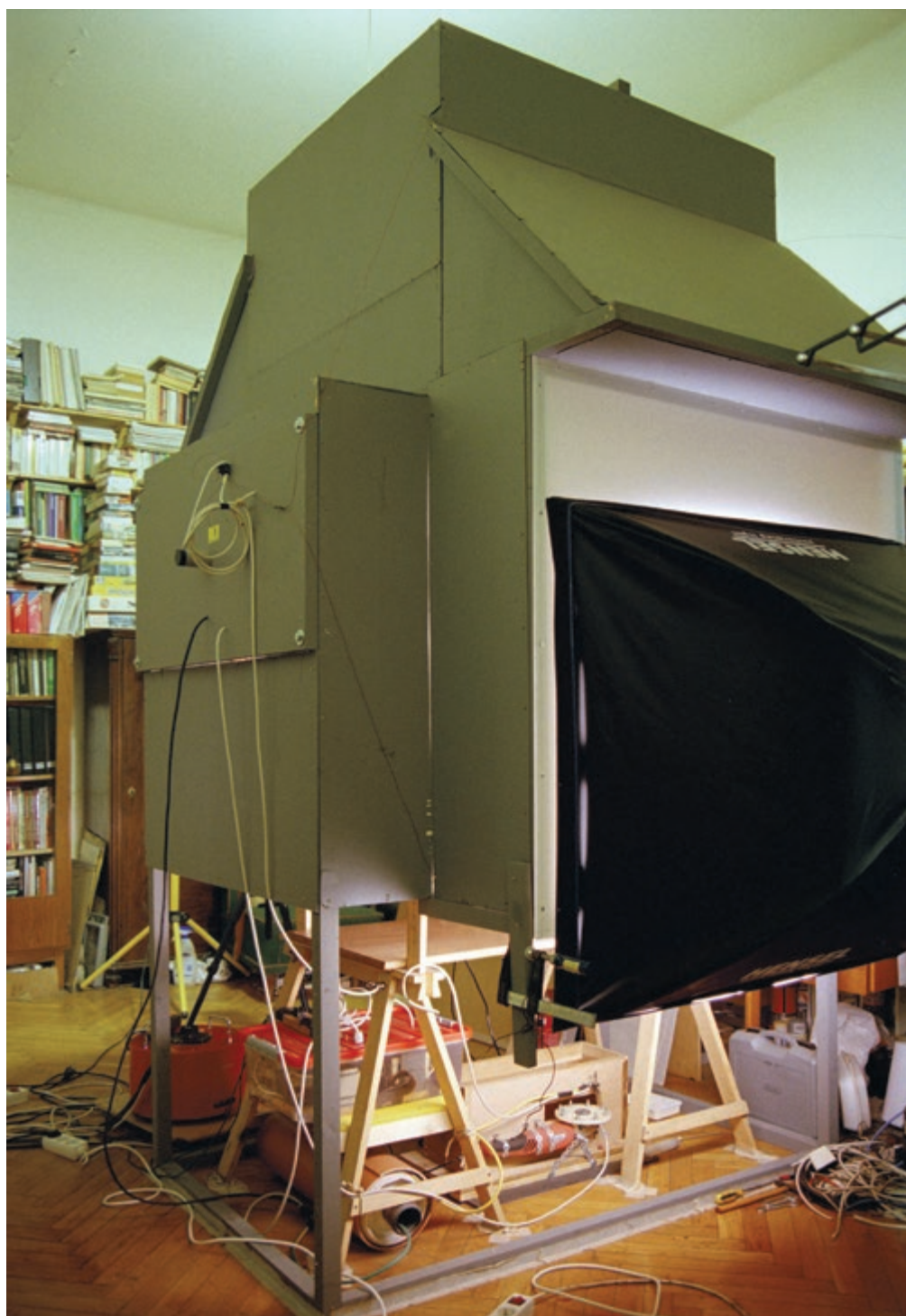
Studio (A Magasfeszültség-sorozat megvalósításához épített Tesla-transzformátor és berendezés), 2012, giclée nyomtat, karton, 198 × 126 cm