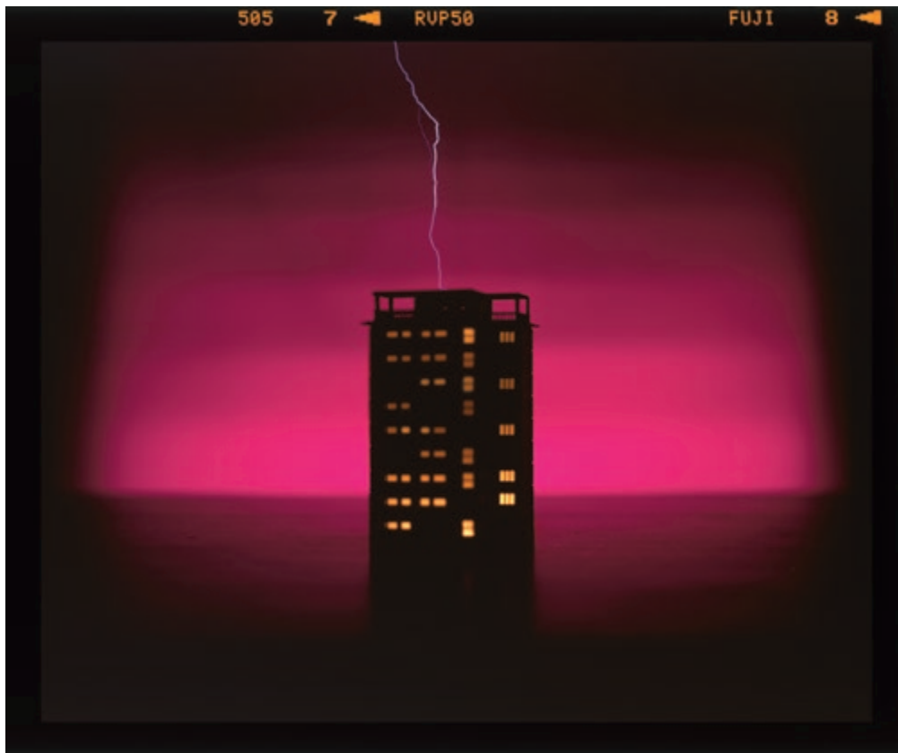
SZABÓ DEZSŐ High Voltage V/V, 2012 120 × 144 cm (145 × 160 cm), C print, ed3 Vintage Galéria, Budapest