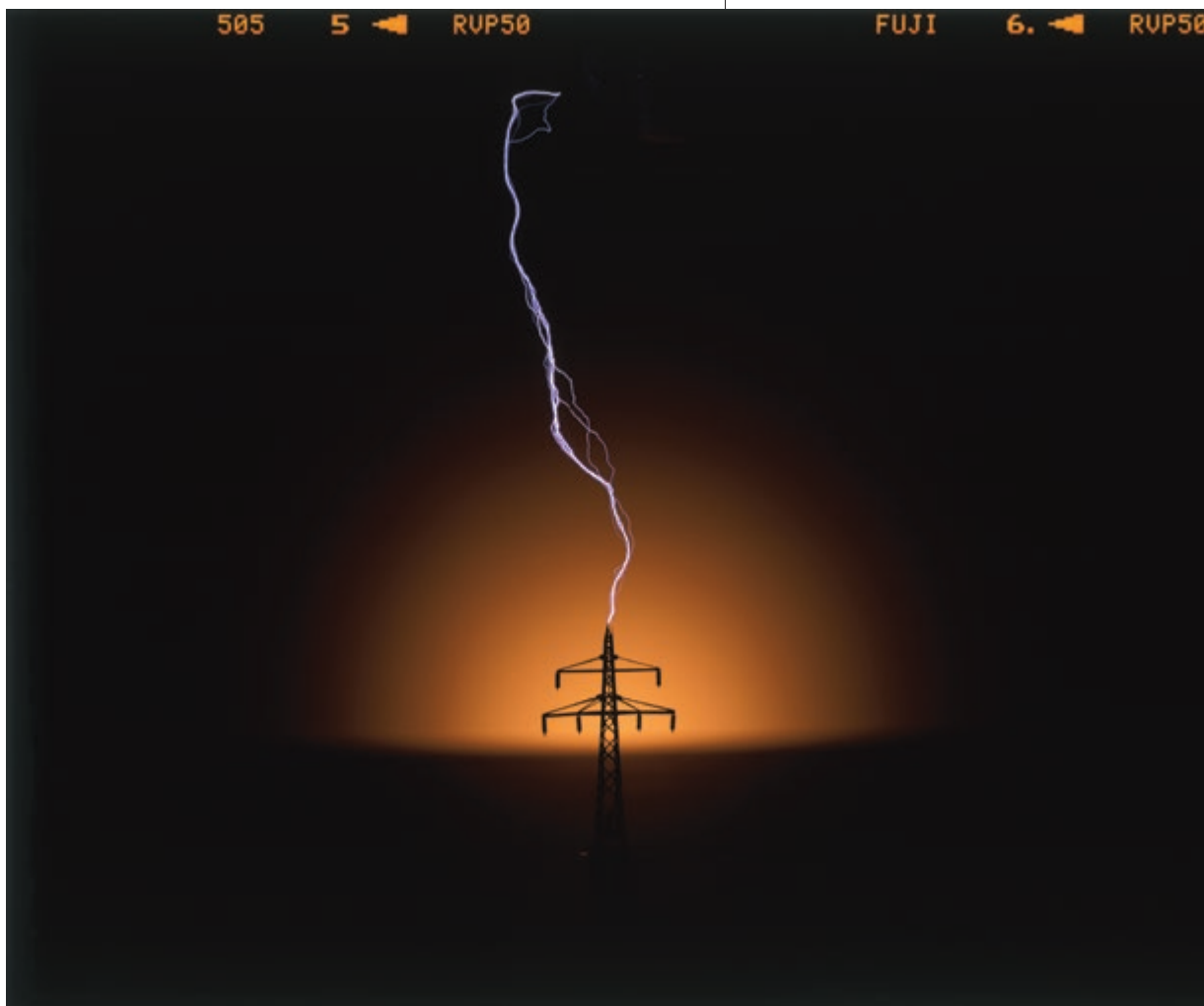
SZABÓ DEZSŐ High Voltage V/I, 2012, 120×144 cm (145×160 cm), C print, ed3 Vintage Galéria, Budapest