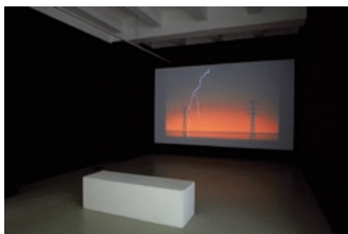
SZABÓ DEZSŐ Electric Field, 2012, loop 17min © fotó: Surányi Miklós Vintage Galéria, Budapest