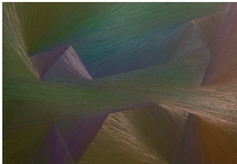
BERNÁT ANDRÁS Tér tanulmány No. 98, 2012, olaj, vászon, 50x70 cm

mint festészeti alapelem egyszerűbbnek tűnik a hullámvonalhoz képest, ugyanakkor nagyon bonyolult téri szituációkat lehet vele elérni. A párhuzamos egyenes ecsetvonások egyszerű síkot képeznek, ha az egyenesek egymáshoz képest kisebb nagyobb szögben jobbra-balra dülöngélnek, akkor csavart felületet kapunk, amely már a harmadik dimenzióban kanyargó szalag illúzióját kelti.