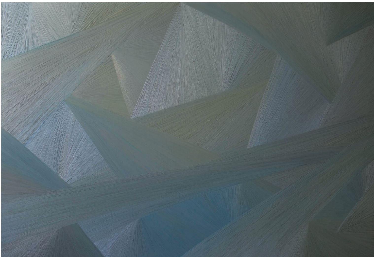
BERNÁT ANDRÁS Tér tanulmány No. 116, 2012, olaj, vászon, 90x130 cm

Az egyenesek legyezőszerű terítésével kristályalakzatokat hozhatunk létre. Ezeket a síkokat más síkokkal metszhetjük, és még újra behozhatjuk a képbe a görbéket is.