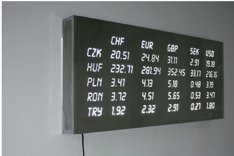
CSEKE SZILÁRD Rögzített árfolyam, 2012, acél, fénycsövek, plexi üveg, 72×158×12 cm