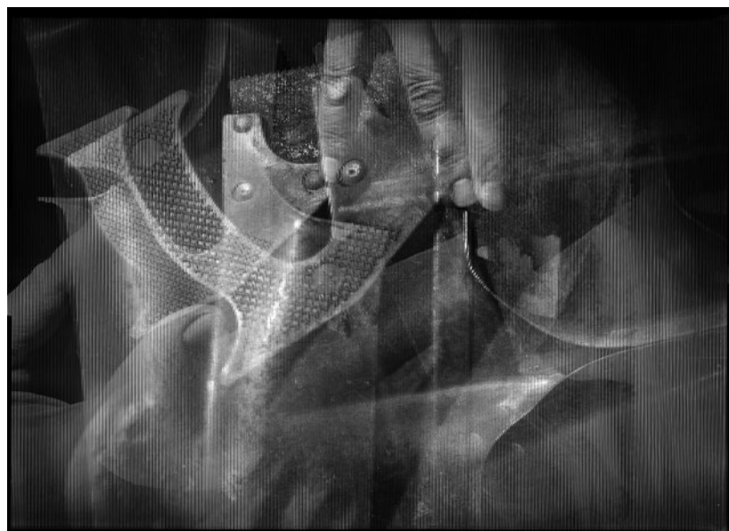
SZEGEDY-MASZÁK ZOLTÁN Hardver tekintetében, 2012, nagyítás a lenticuláris optikán keresztül többszöri expozícióval létrejött képről, zselatinos ezüst fotó, 43×60 cm