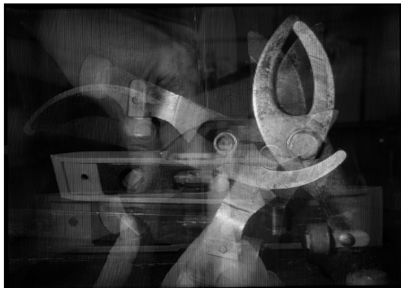
SZEGEDY-MASZÁK ZOLTÁN Hardver tekintetében, 2012, nagyítás a lenticuláris optikán keresztül többszöri expozícióval létrejött képről, zselatinos ezüst fotó, 43×60 cm