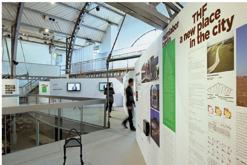
A Pavillon de l'Arsenal kiállításának részlete

A kiállításon bemutatott projektek meglehetősen sokfélék. A román származású építész-páros, CONSTANTIN PETCOU és DOINA PETRESCU által létrehozott ATELIER D'ARCHITECTURE AUTOGÉRÉE (AAA) – amely egyébként mind az AzW kiállításán, mind a Velencei Biennálén kiállít, és egyébiránt Urban Act címmel maga is kiadott egy részletes katalógust a hasonló építészeti szervezetekről 10 – 2001-ben kezdeményezte egy kelet-párizsi foghíjtelken a Passage 56 elnevezésű közösségi tér létrehozását, amely közösségi kertként, helyi szervezetek és csoportok találkozóhelyeként működik azóta is. Az Ecosistema Urbano „mesterséges fája” egy energiatermelő struktúra, amely közösségi teret hoz létre egy olyan madridi külvárosban, amelynek a közösségi dimenzióit fejlesztői teljesen elhanyagolták. A már Budapesten, a Ludwig Múzeum Yona Friedman kiállítása kapcsán is ismerős párizsi EXYZT kollektíva 11 egy Grenoble-közi kisvárosban, Saint-Jean en Royans-ban épített egy nemrég lebontott épületből közösségi kioszkot, amely hamar a környék jövőjéről való beszéd középpontjává vált. A pár