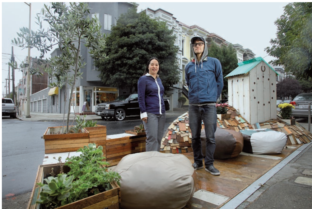
A Park(ing) Day