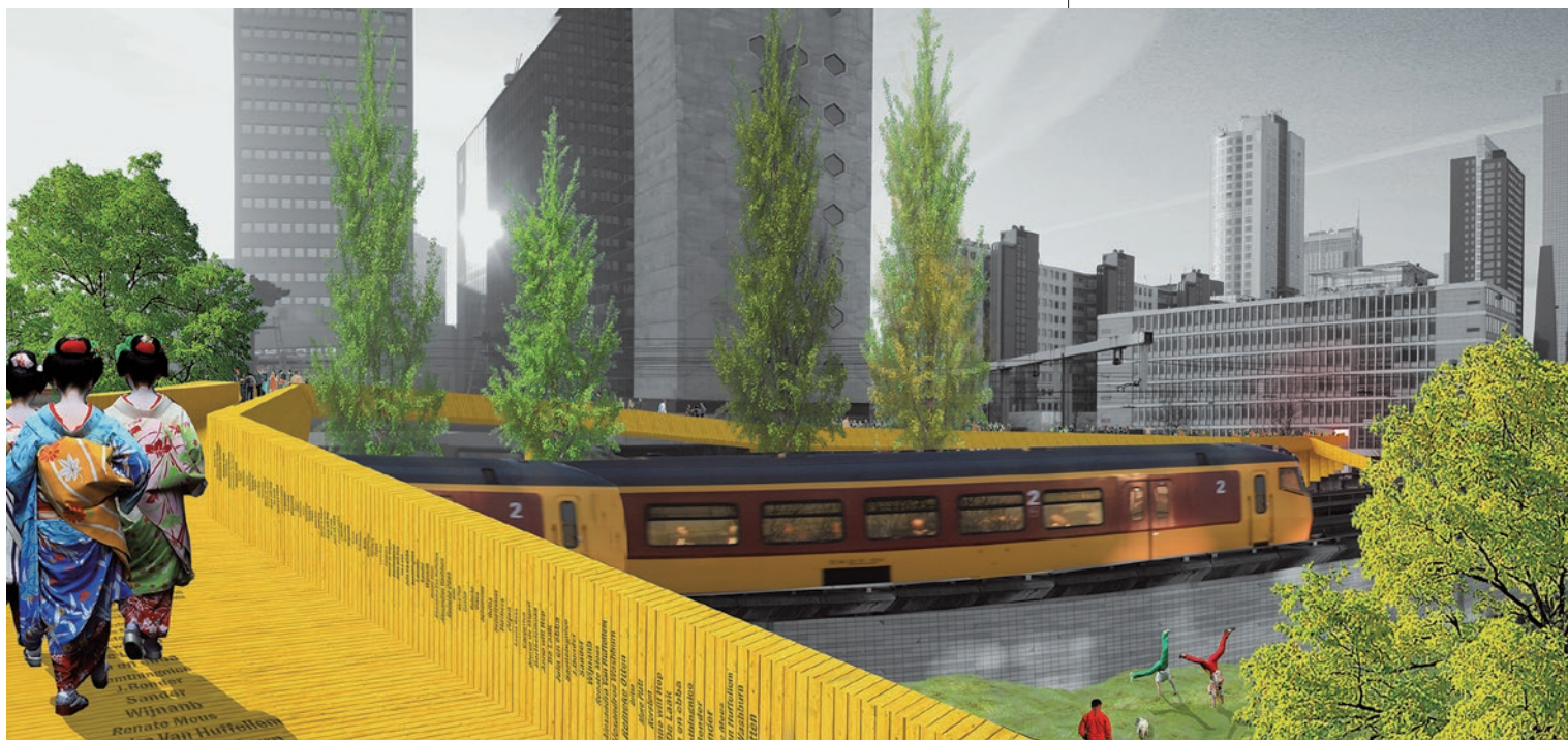
A rotterdami gyalogoshíd terve

éve szintén Budapestre látogató 12 RAUMLABOR BERLIN egy, az Essent és Mülheimet összekötő autópályák között elhelyezkedő metróállomást alakított át ideiglenes operaházzá, amely a helylakosok által elmesélt történetek opera-feldolgozásait játszotta, ilyen módon újrahangolva és étellel töltve meg az amúgy elhagyott, veszélyes környéket. A rotterdami ZONES URBAINES SENSIBLES csoport tagjai, az idei Rotterdami Építészeti Biennálé 13 kurátorai, egy elhagyott belvárosi irodaházat vettek gondozásukba, befogadva a helyi kreatív ipar start-up cégeit és szervezeteit, egy közösségi finanszírozású gyalogoshíddal kötve vissza az autótak által elszigetelt épületet a város vérkeringésébe.