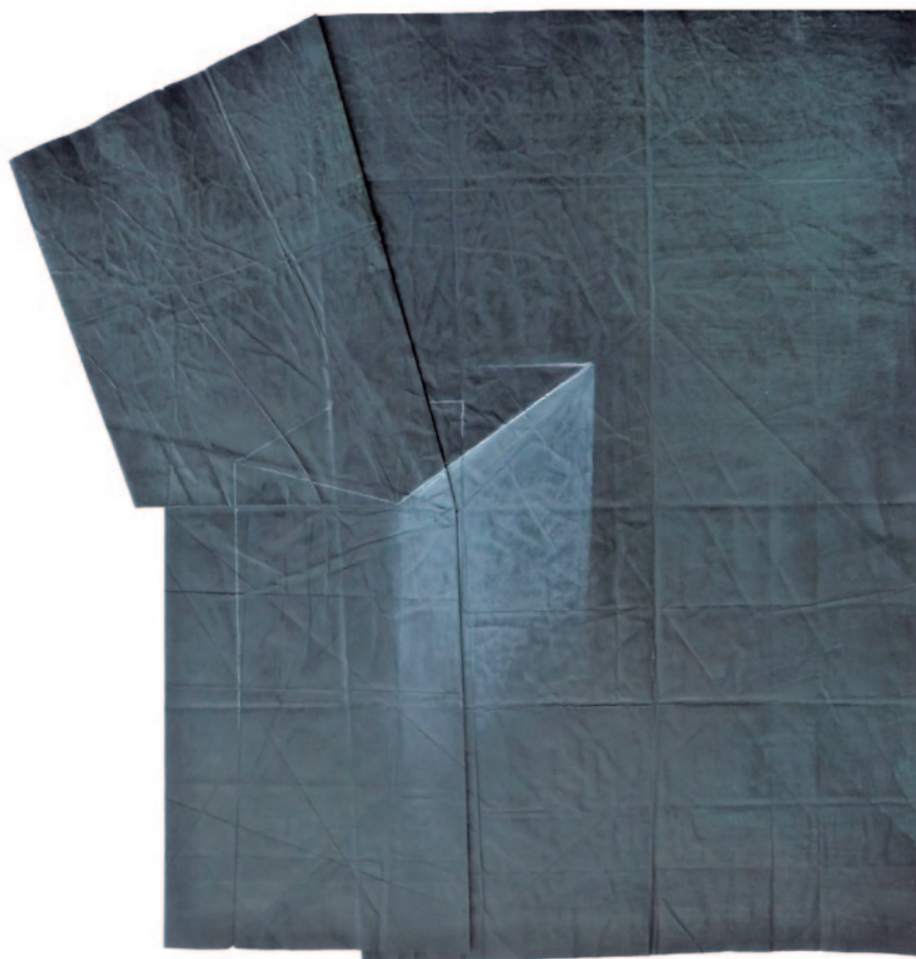
SCHMAL KÁROLY Kitérítve, 2011, papír, akril, akvarell, kréta, 45 × 45 cm

és a virtuális tér között”, 2 mely mozgás szavak vezényletével történik, de nem is lehetne másként, erről győz meg a tárlat, hiszen az emberi tér a beszéd – mint a mindent átszövő textualitás – nélkül csupán a csendet visszhangozná.