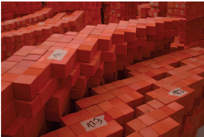
OROSZ KLÁRA Pixelbuborék , 2012 (építési folyamat)