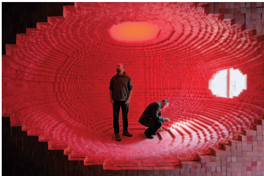
OROSZ KLÁRA Pixelbuborék, 2012

különböző műszörmékkal bevont habszivacs idomok [ Falkamodul ]), melyeket a látogatók rendezhetnek be és mozgathatnak, ezáltal szociális miliővé alakítva át a kiállítóteret. A néző bevonására tett kísérlet rendhagyó helyzetet hoz létre a galéria környezetén belül: a művek nem a konvencionális módon vannak bemutatva, „kitéve” a befogadó előtt, hanem funkcionális szerepet töltenek be.