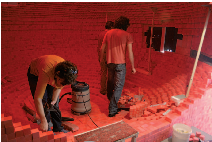
OROSZ KLÁRA Pixelbuborék, 2012 (építési folyamat)