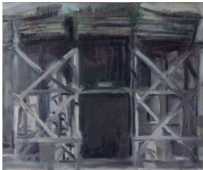
KÁROLYI ZSIGMOND A Teréz templom télen, 1987, olaj, vászon, 50 × 60 cm