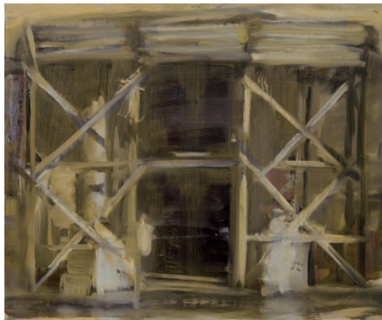
KÁROLYI ZSIGMOND Állványok, 1987, olaj, vászon, 50 × 60 cm