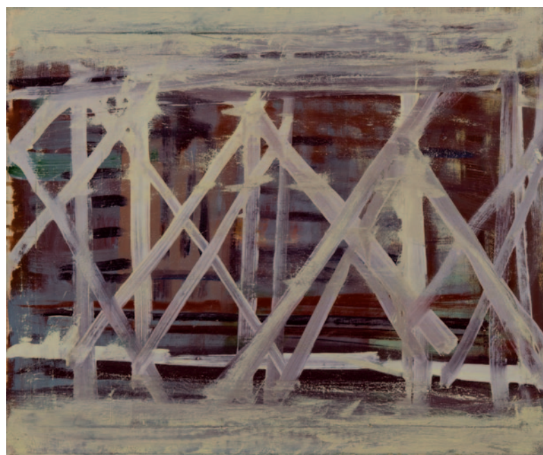
KÁROLYI ZSIGMOND Állványok, 1987, olaj, vászon, 50 × 60 cm