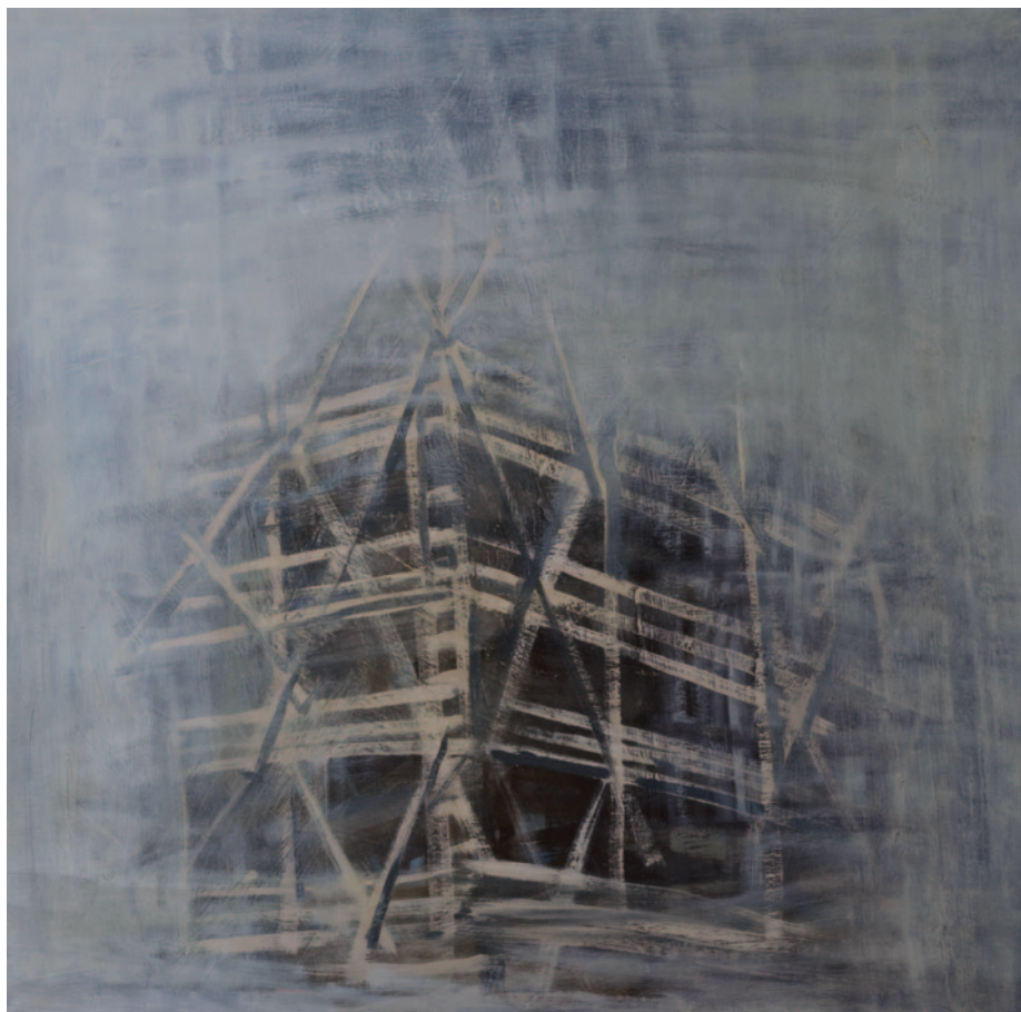
KÁROLYI ZSIGMOND Állványok, 1987, olaj, vászon, 83 x 83 cm