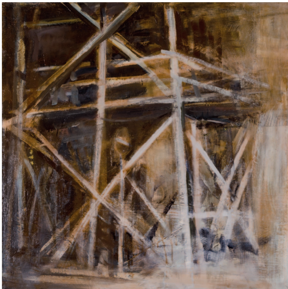
KÁROLYI ZSIGMOND Állványok, 1987, olaj, vászon, 83 x 83 cm