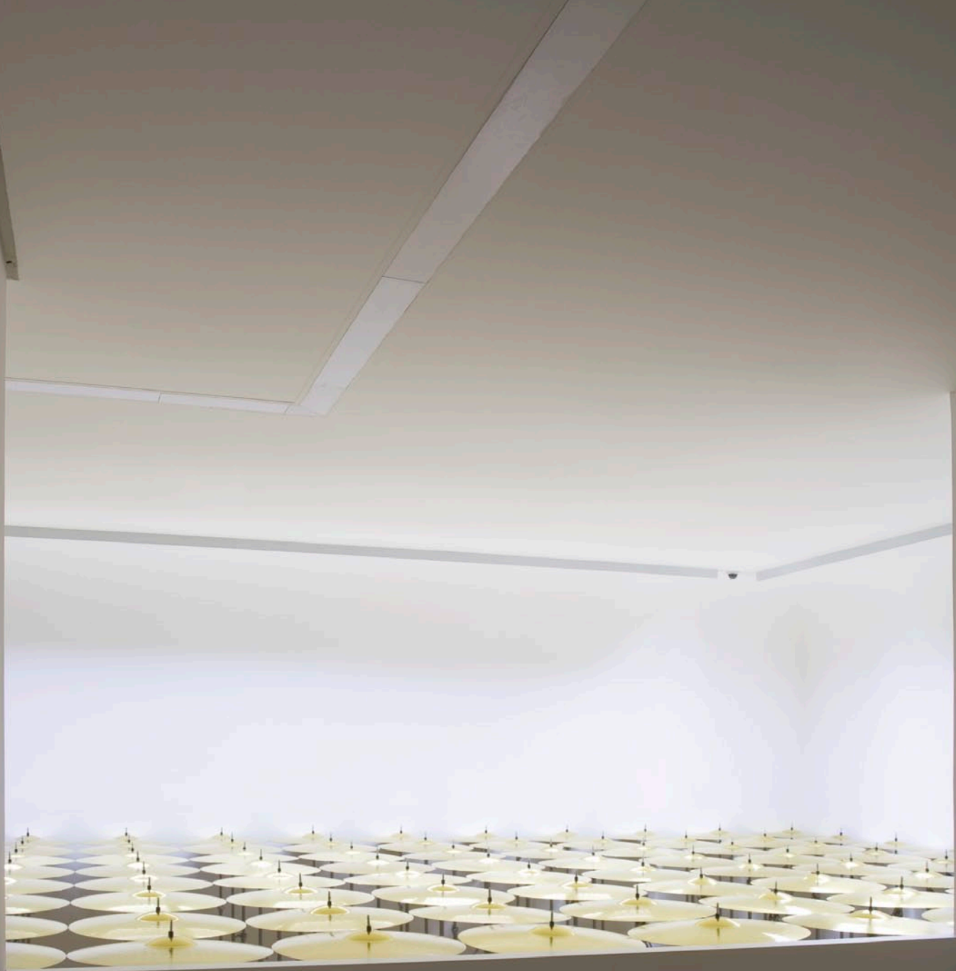
Stéphane Vigny Cím nélkül, 2011, installáció