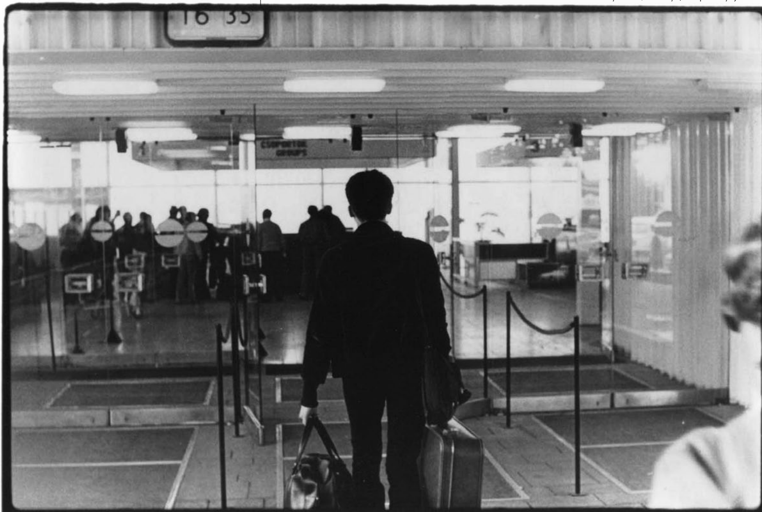
1978. május 2. – A SPIONS elhagyja Magyarországot