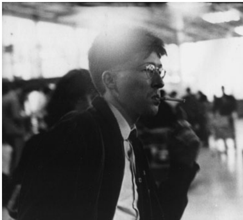
1978. május 2. – A SPIONS elhagyja Magyarországot