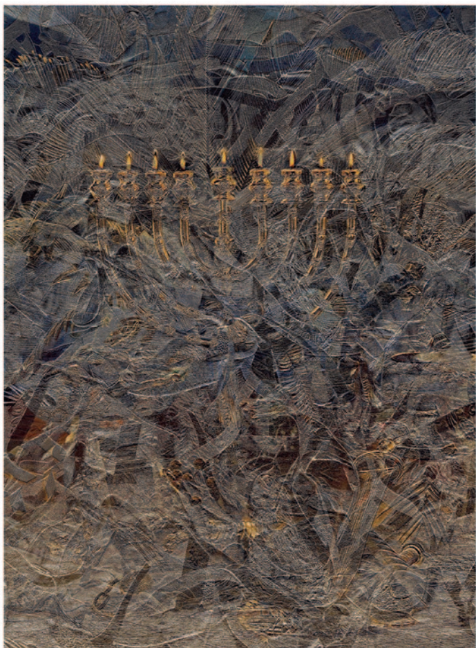
LAJTAI PÉTER Menóra No.1, 2005, Lamda Print, 171×133 cm

A 2005-ös budapesti kiállításnak vallomásként adtam a Meggyőződés és kétség címet. Az ott bemutatott munkáimmal azt sugalltam, hogy a vallási érzület, a logika, a gondolkodás mind egy fejlődés-spirál része. A brüsszeli kiállítás címe azért lett Azonosságok és különbségek – posztmodern judaizmus , mert az egyik legfeltűnőbb ellentmondást abban látom, hogy miközben a nyugati civilizáció tagjainak életmódjában és kultúra-fogyasztásában egyre több a hasonlóság, a társadalmat alkotó csoportok között meglévő különbségeket aránytalanul túlharsogják.